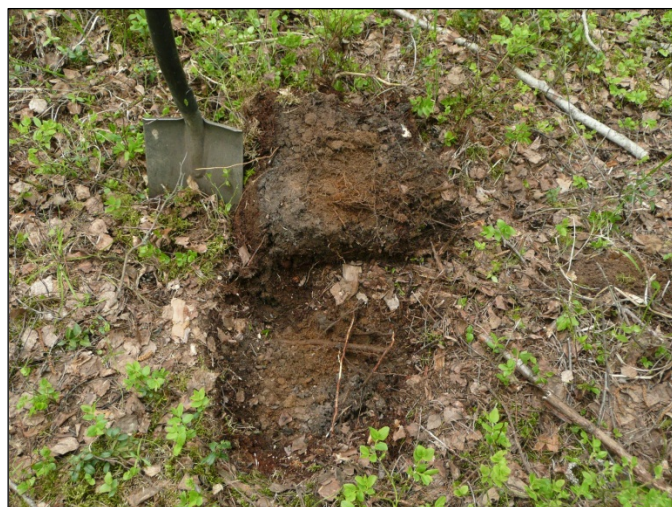
Alueella maaperä on pääosin hiekkamoreenia. Kuva koekuopasta.