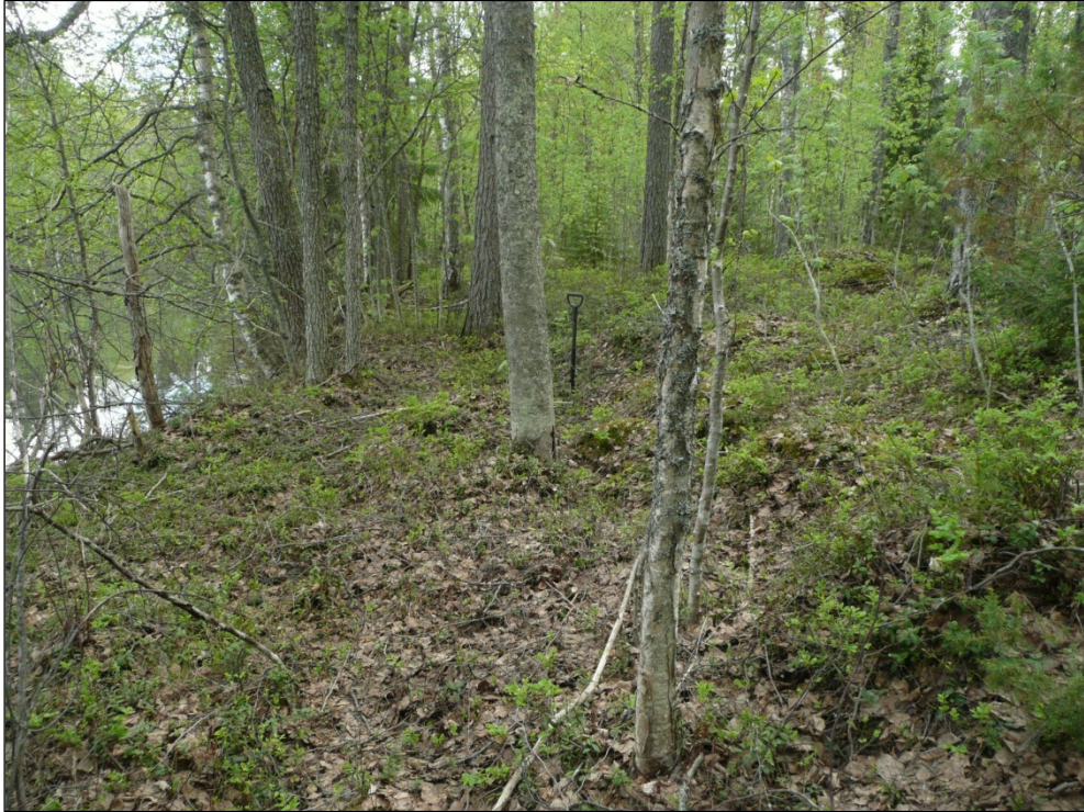
Tasainen rantatörmä. Tutkimuksissa tiheästi kuopitettu alue.