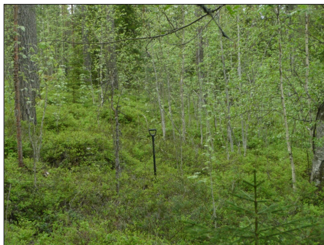
Jyrkkäpiirteistä ja kivikkoista alueen maastoa