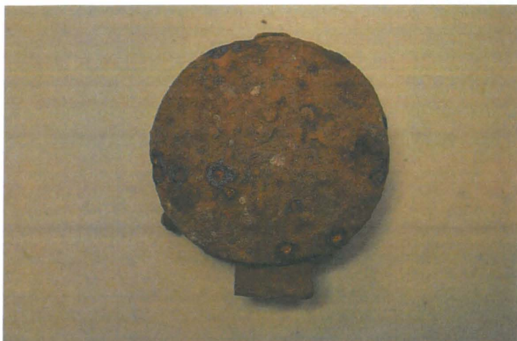
KYY 161 : 4 Miekan ponsi Valkeakosken Vähä-Kantalan rautakautisesta kalmistosta. 20.08.2015

Valkeakoski, Vähä-Kantala, arkeologinen kohde