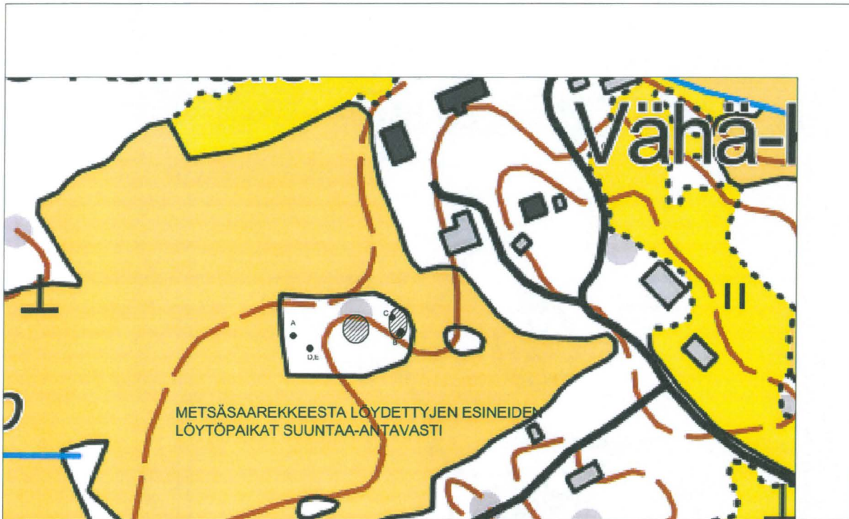
Kartta 4. Esineiden löytöpaikat suunta-antavasti.