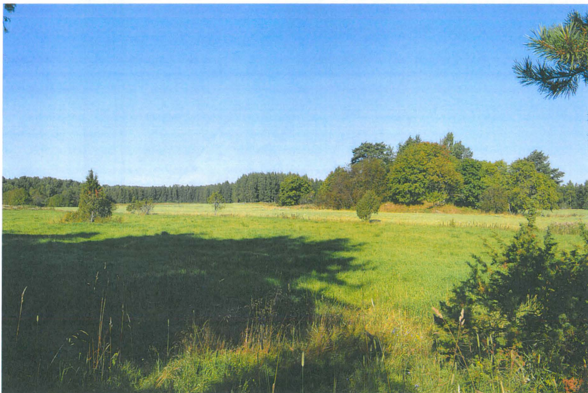
KYY 161 : 1 Yleiskuva Valkeakosken Vähä-Kantalan rautakautisen kalmiston sijainnista, kuvattu 2015.