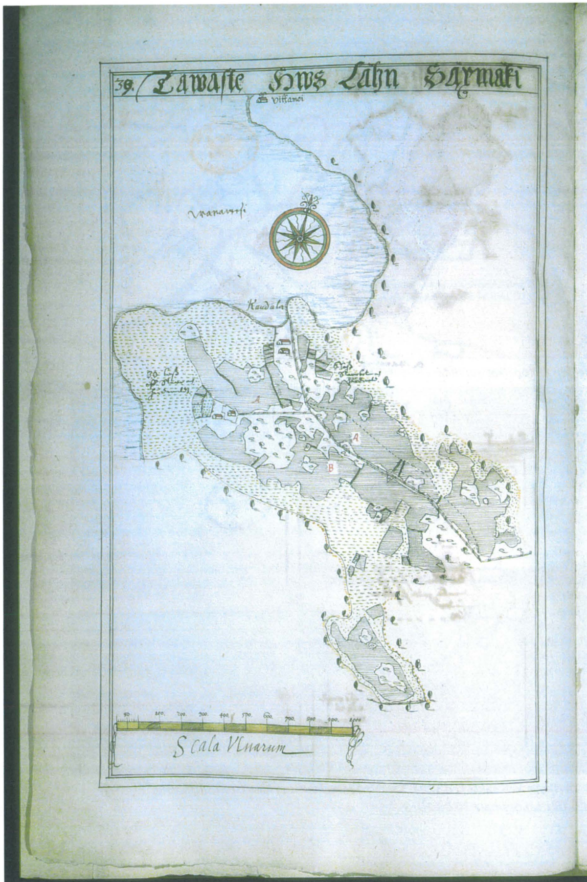
Kartta 3. Sääksmäki, Kantala, Lars Schroderuksen kartta vuodelta 1640 (KA bb1a:39). Kantalan kylän tonttimaa ylhäällä oikealla ja toinen alue keskellä vasemmassa reunassa. Rautakautisen kalmiston saareke todennäköisesti jälkimmäisen tonttimaan pohjoispuolella.