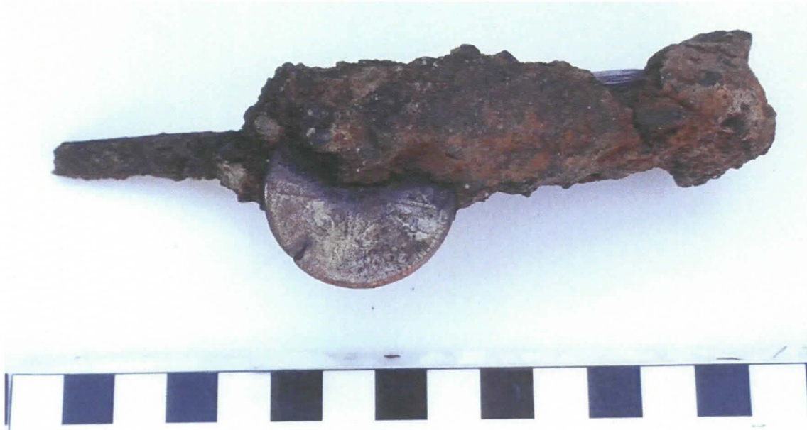
Kuvat 3. ja 4. Markku Käännän Museovirastolle syksyllä 2006 luovuttama löytö 1980-luvulta, joka koostuu rautanaulasta ja kahdesta metallirahasta. Kuvattu ennen konservointia, löydölle annettu numero SMM402006:1.