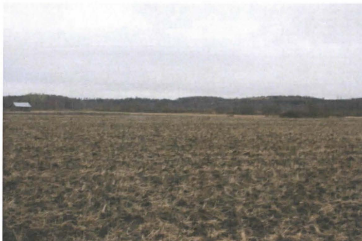
AKDG3899:7. Näkymä Linjapellon peltosaarekkeelta kohti Loimijokea. Pohjoisesta.