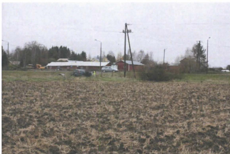
AKDG3899:3. Yleiskuva tutkimusalueen länsiosasta. Tammelantien pohjoispuolella Vanhan-Similän tilan rakennuksia. Eteläkaakosta.