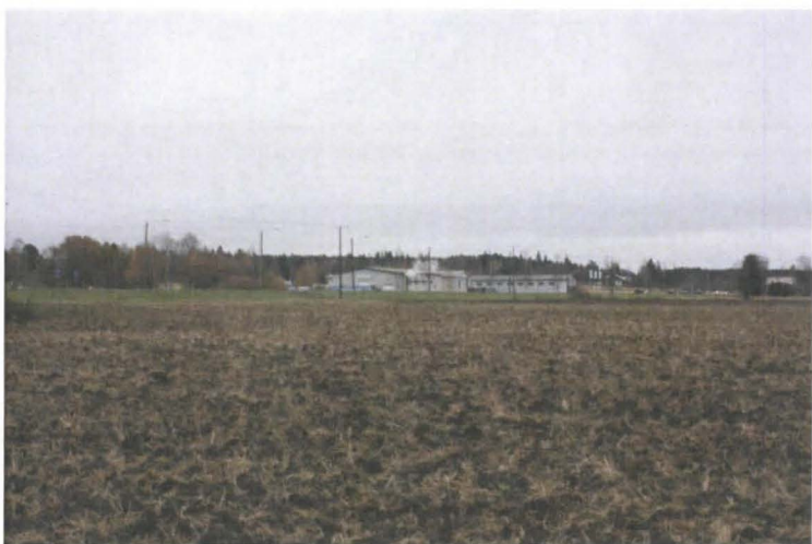
AKDG3899:6 Näkymä tutkimusalueen itäosasta kohti koillista. Lounaasta. 22.10.2014