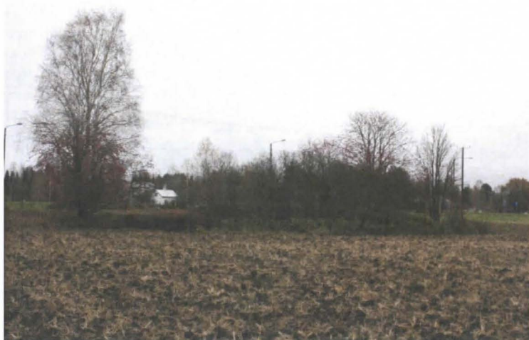
AKDG3899:2 Linjapellon oletettu kivistinen asuinpaikkakumpare lounaasta kuvattuna. 20.10.2014

Seuraavassa esitellään tutkimusten aikana otettu ja WebMuskettiin tallennettu digitaalinen kuva-aineisto soveltuvien osien. Kuva-aineisto on talletettu numeroilla AKDG3899:1-7.