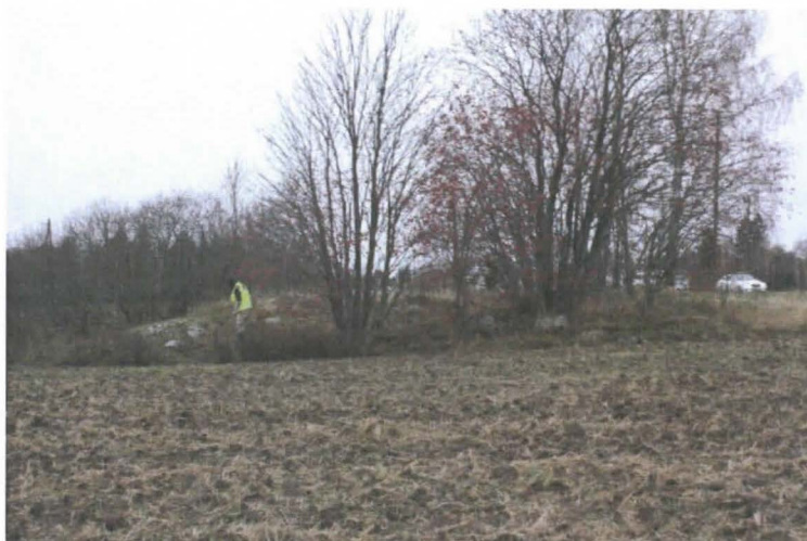
AKDG3899:5. Yleiskuva tutkimusalueen itäosasta. Idästä.