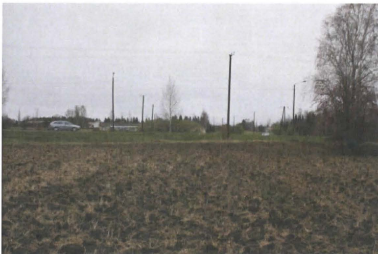
AKDG3899:4. Näkymä. Yleiskuva tutkimusalueen länsiosasta Tammelantielle. Etelästä. 20.10.2014