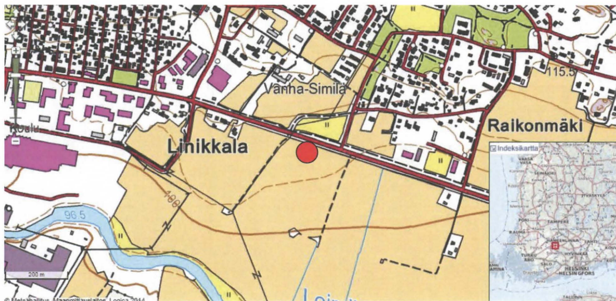
Tutkimusalue sijoittuu punaisen ympyrän rajaamalle alueelle. Karttalähde www.retikartta.fi . Ei mittakaavassa.