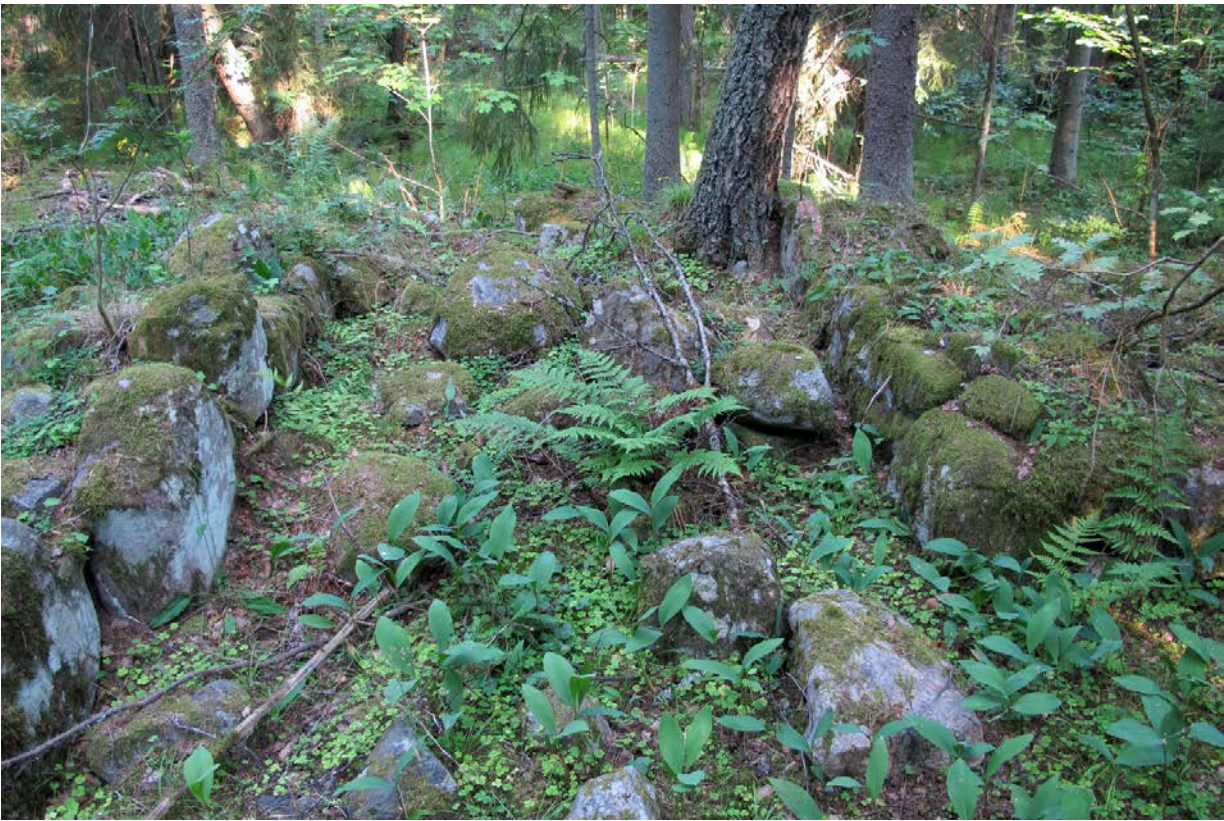
Kuva 3. Luoteisosan epämääräistä kivikkoa.