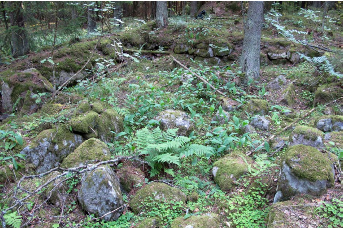
Kuva 2. Kivijalka on varsin huolellisesti rakennettu ja siinä on kivikerroksia on kahdessa kerroksessa.