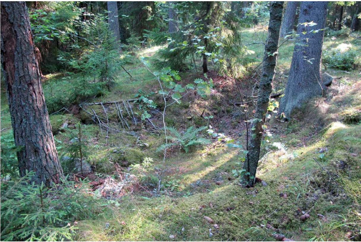
Kuva 5. Syvennys sivusta kuvattuna.