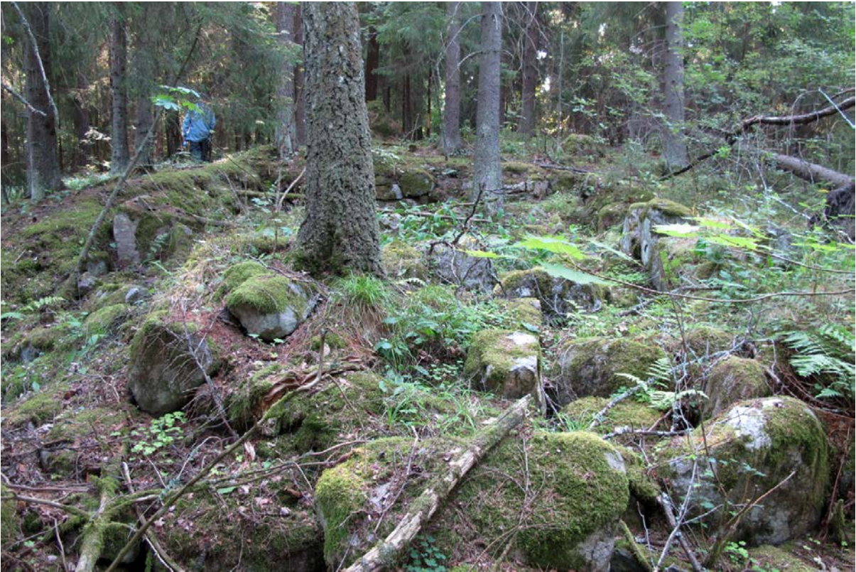
Kuva 1. Kivijalka kuvattuna luoteesta.