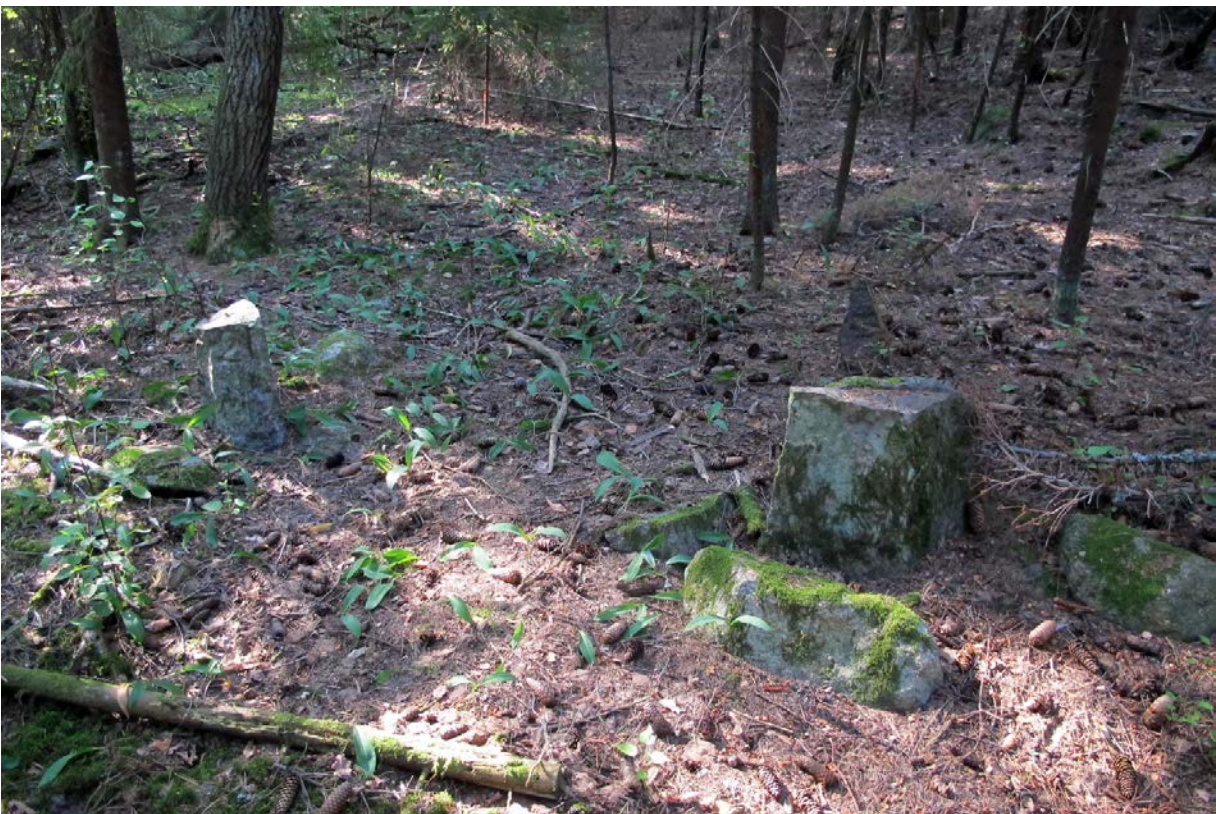
Kuva 6. Kivijalasta parikymmentä metriä kaakkoon olevia vanhoja rajakiviä. Edessä oikealla rajapyykki numero 4.