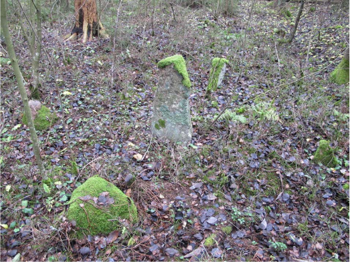
Kuva 7. Rajapyykki numero 1.