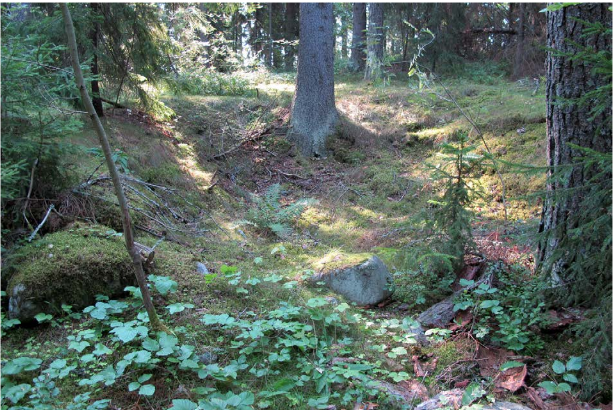
Kuva 4. Kivijalan länsipuolella oleva kuoppa tai syvennys, mahdollinen kellarin pohja.