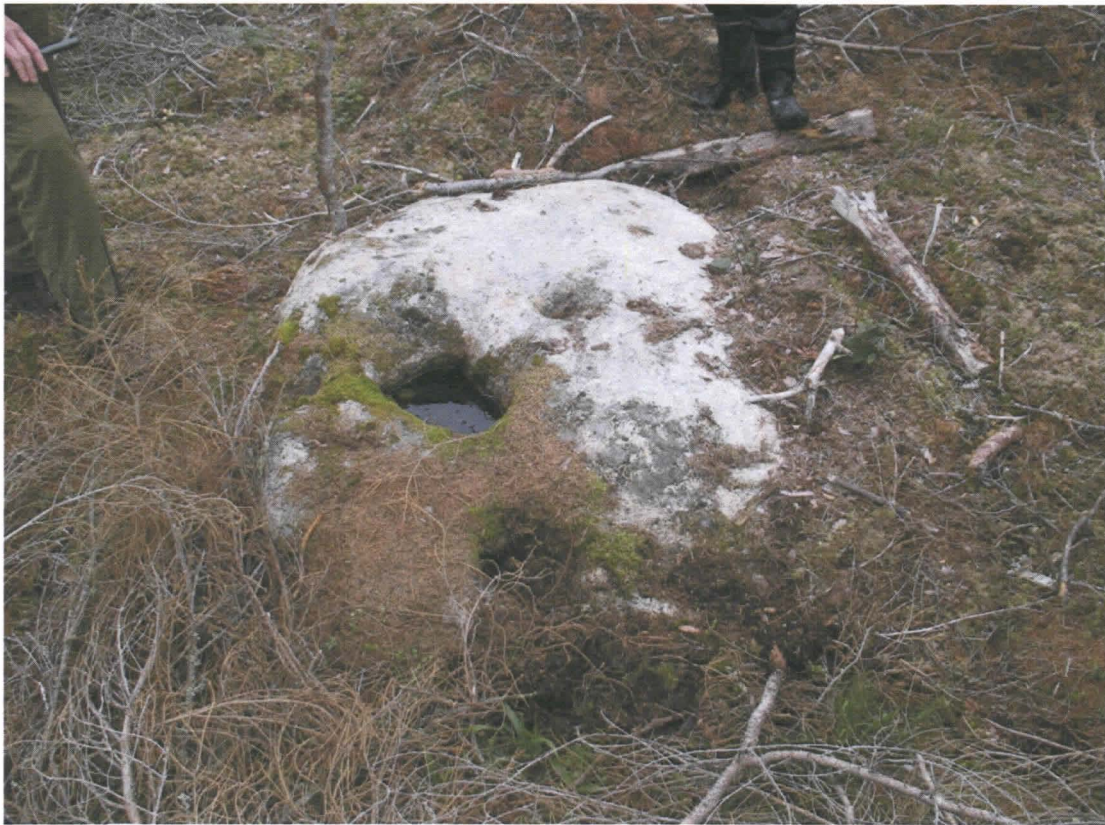
Kuva 6. Ns. ”kuppikivi”, jossa kupit ovat luonnon muovaamia.