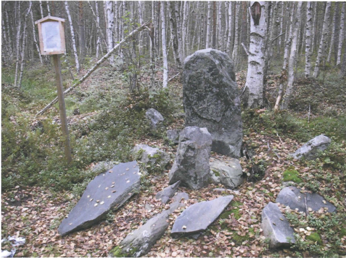
Kuva 1. Rajakivi ja sen viereen pystytetty opastaulu.

KERTOMUKSEEN LIITTYVÄT KUVAT: 3.9.2008