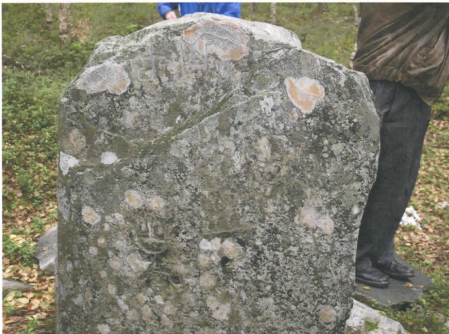
Kuva 3. Kiven takaosa.