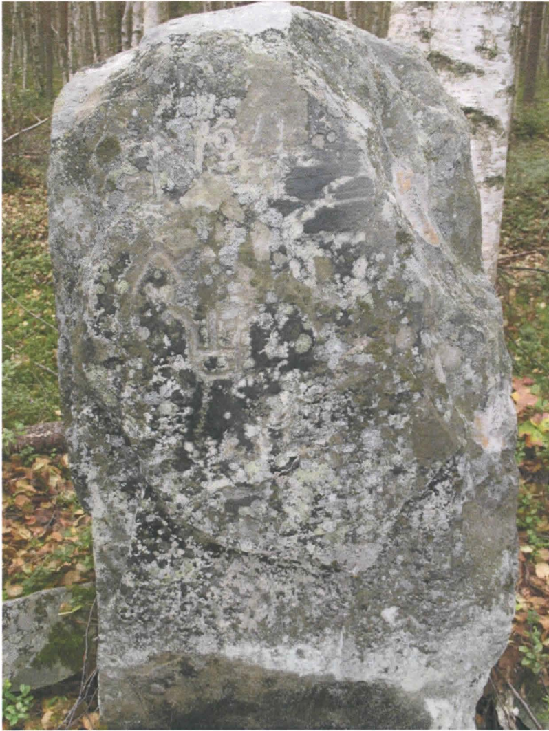
Kuva 2. Kiven etuosa.