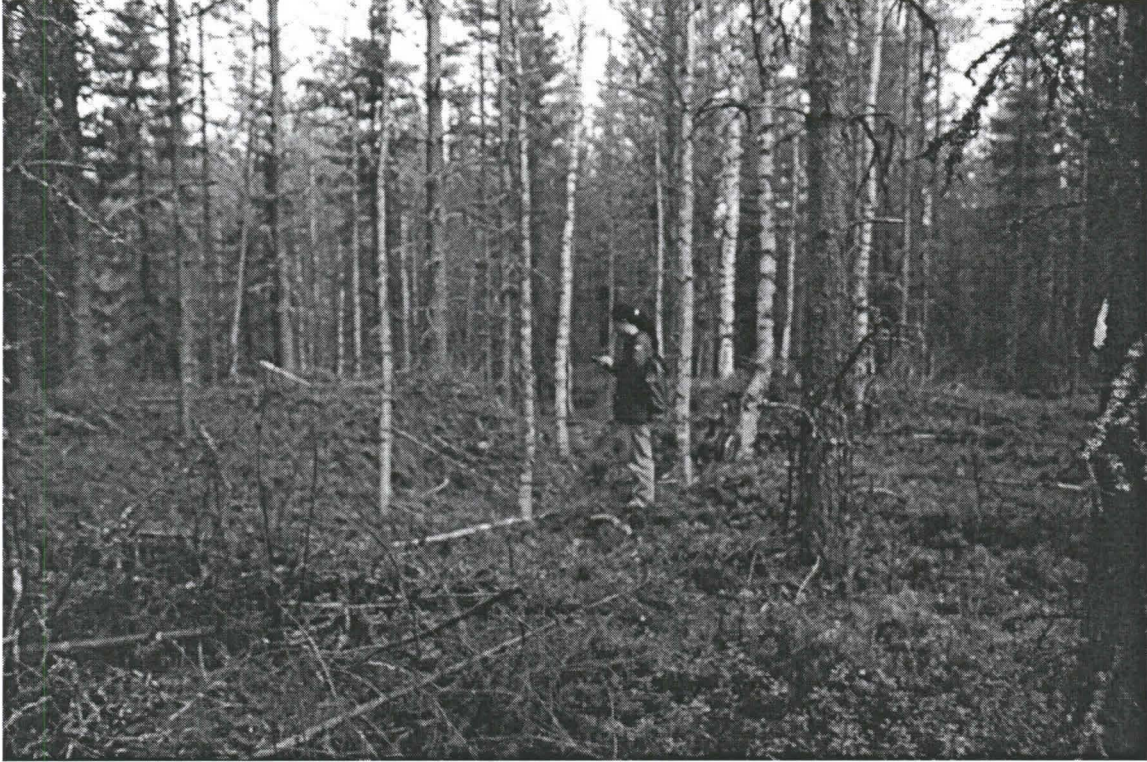
Kuva 1. Oulunsalo Oulunsalo Viinankeittokangas. Kuvassa asumuskuopan reunalla Katja Lappi. Kuva otettu luoteesta. (Kuva Tiina Äikäs, Oulun yliopisto, Arkeologian laboratorio Dia 24174)