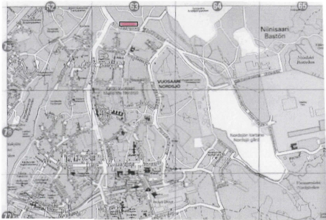
HPY:n kartta 1999, s. 24

- karttaliite hoidon ja käytön tarkastukseen