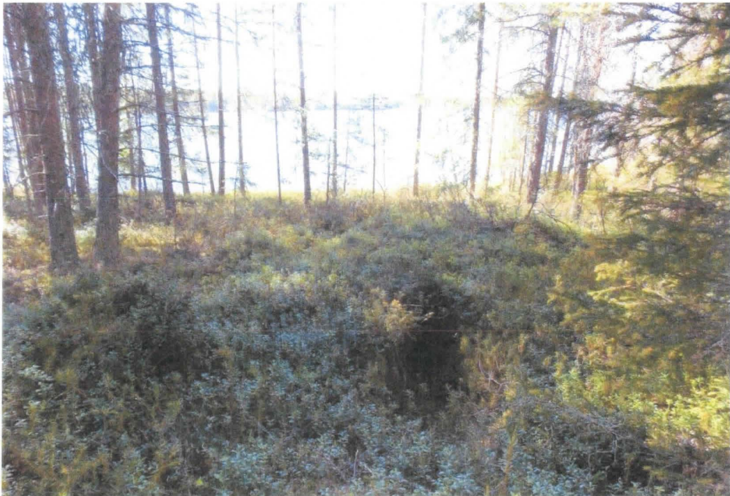
Ruumissaaren hautakuoppa harjanteen länsipäässä. Kuva: M. Sarkkinen (PPM DG VH 8:2013:05:01)