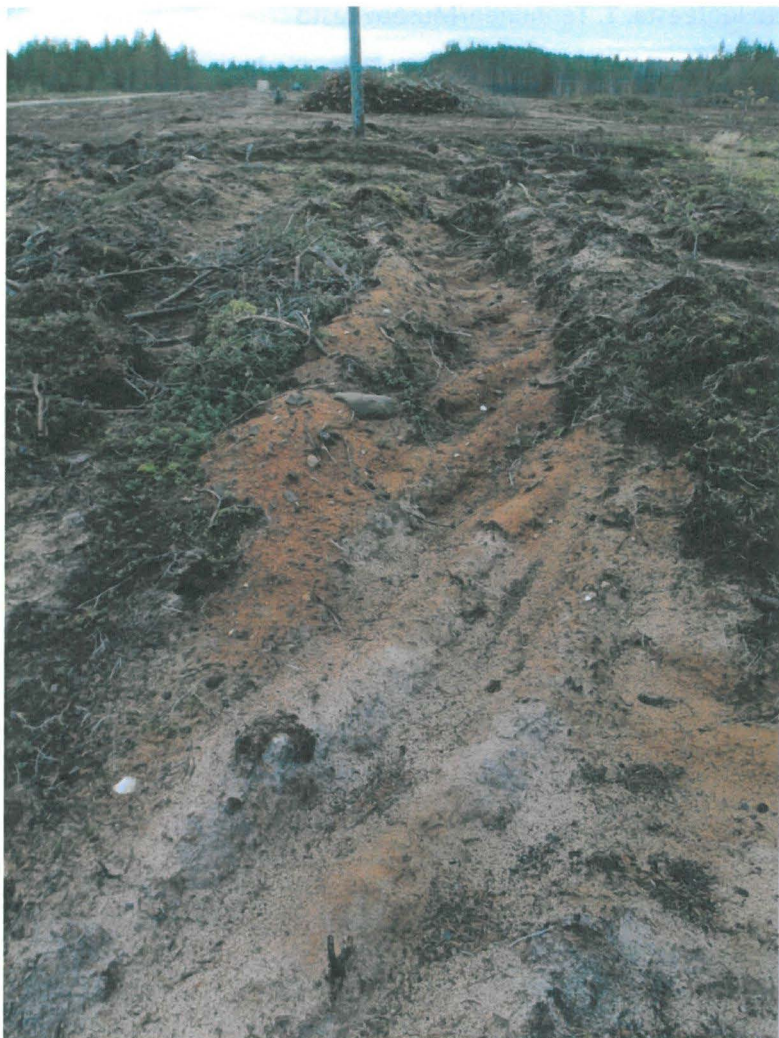
Kuva 5. Asumuspainanne 1 kuvattuna koillisesta. Kuvassa näkyvät valkoiset kivet ovat kvartsi-iskoksia. Asuinpaikka-alueen muinaisjäännösrekisteriin merkitty lounaisraja on kuvan keskellä seisovan puun kohdalla.