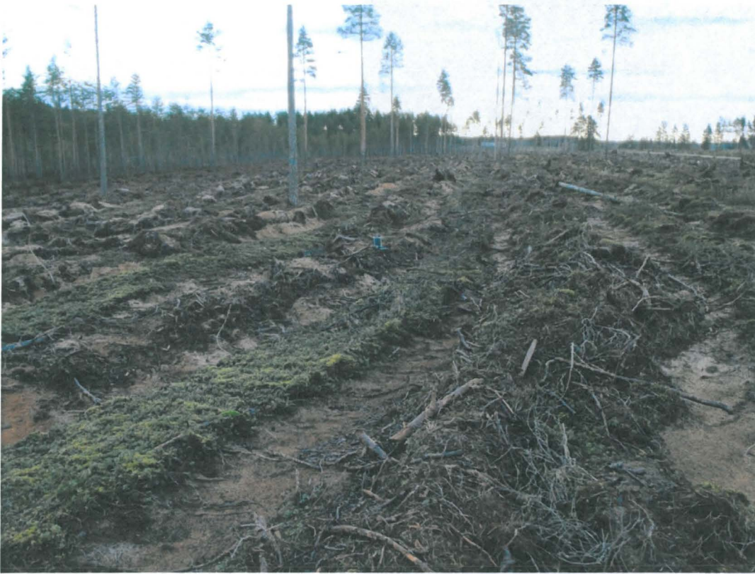
Kuva 4. Yleiskuva asuinpaikka-alueesta 17.11.2011. Kuvan keskellä näkyvä maastotietokone on painanteen 2 kohdalla. Kuvattu lounaasta.