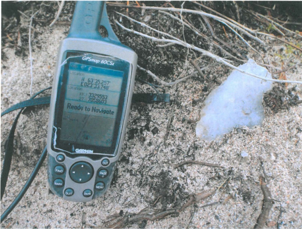
Kuva 6. Yksityiskohtakuva kvartsi-iskoksesta muokatussa maassa.

Tarkastuksessa todettiin, että Terjärv-Lissantinoosi asuinpaikan Kyröläntien pohjoispuolella oleva alue on kokonaisuudessaan kärsinyt merkittäviä vaurioita. Asumuspainanteita on vaikea erottaa maastossa ja kivikautiseen asuinpaikkaan kuuluva maanpinnan alapuolella oleva osa on rikkoutunut. Tunnetusta muinaisjäätösalueesta noin 1/3 on kärsinyt vaurioita.