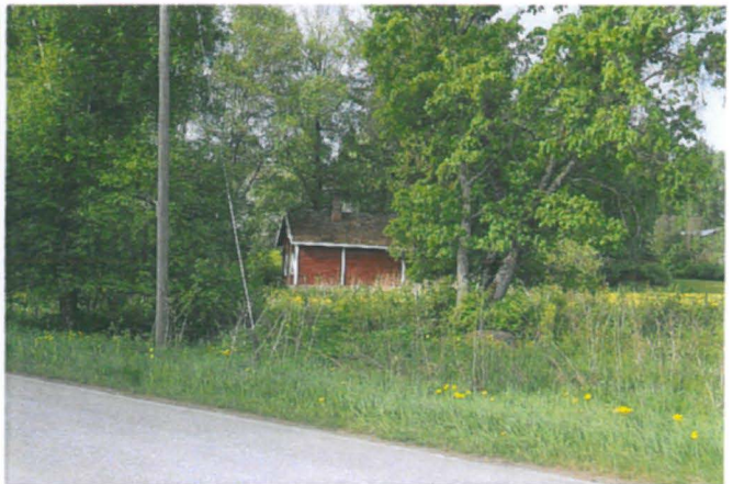
Kyy 110 : 7 Uhrikivi Paasian tilalla Tarttilassa. Kiven sijainti suhteessa Paasian saunaan ja Kuurilantiehen.