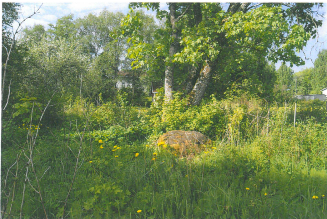
Kyy 110 : 5 Uhrikivi Paasian tilalla Valkeakosken Tarttilassa. Taustalla näkyy Paasian sauna ja päärakennus.