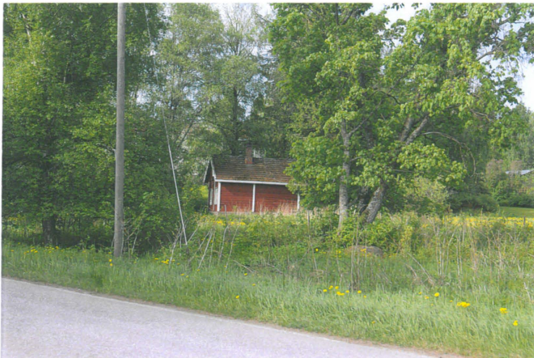
Kyy 110 : 7 Uhrikivi Paasian tilalla Tarttilassa. Kiven sijainti suhteessa Paasian saunaan ja Kuurilantiehen.