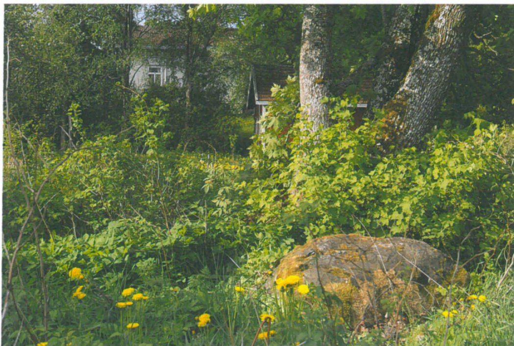
Kyy 110 : 6 Uhrikivi Paasian tilalla Valkeakosken Tarttilassa. Taustalla näkyy Paasian sauna ja päärakennus. 28.05.2013