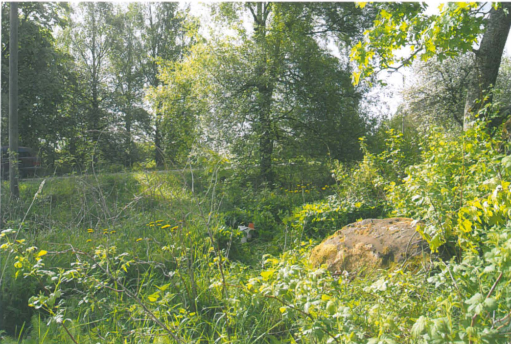
Kyy 110 : 4 Uhrikivi Paasian tilalla Valkeakosken Tarttilassa, taustalla Kuurilantie. 28.05.2013