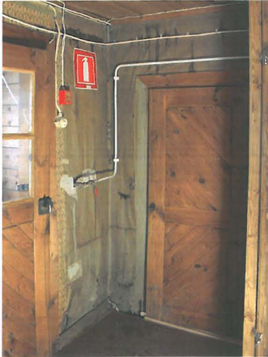
Kellarihuoneen nurkka ennen

pahvia. Nurkassa pahvit naulattiin puskusaumaan ja nurkka siistittiin liisteröimällä siihen kapea suikale pahvia.