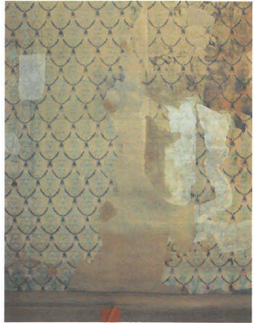
Vaurion päälle liisteröity ruskea pakkauspaperi ja vesivaurioihin japaninpaperi

Seiniltä poistettiin ylimääräiset, boilerin ja sähkörasioiden siirron takia tarpeettomiksi jääneet sähköjohdot. Sähkömies siirsi oven viereisessä nurkassa sijainneet maadoituselektrodit kylmän kellarin osan puolelle. Ulko-oven ympärillä kulkeneiden sähköjohtojen alla olleet kapeat eristelevyt, jotka todennäköisesti sisälsivät asbestia, irrotettiin ja hävitettiin.