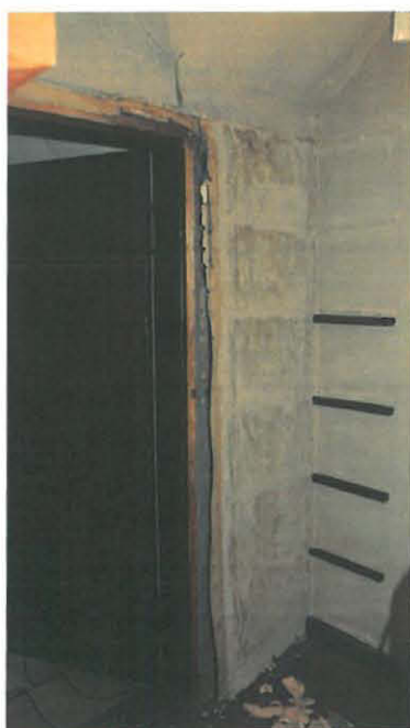
Avattu pinkopahvitus ja nurkan vesivauriot

Nurkan tapetoinnissa ollut laaja kosteusvaurio päätettiin peittää palalla alkuperäisen tapetin uudispainatusta (Pihlgren & Ritola Oy), jota museolla on varastossa. Oven viereen liisteröitiin yksi täysleveä vuota (reunasaumat leikattu) sekä nurkkaan n. 7cm leveä suikale. Täysleveään vuotaan liisteriä levitettiin ainoastaan tapetin reunoihin n. 5cm leveydeltä, suikaleessa koko matkalle.