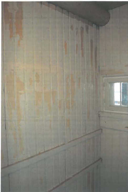
Irtoava maali rapsittu pois ruokakomeron seinistä, takaseinässä 1. krs öljymaalia