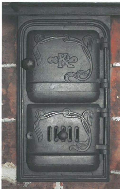
Uuninluukut käsitelty liesimustalla

Lisää ennen ja jälkeen –kuvia kellarihuoneesta raportin lopussa.