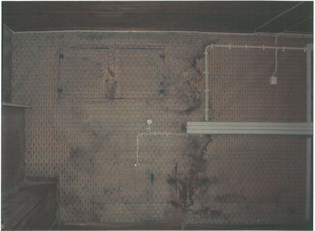
Yllä: Kellarihuoneen luoteen puoleinen seinä ennen konservointia. Alla: Seinä konservoinnin jälkeen