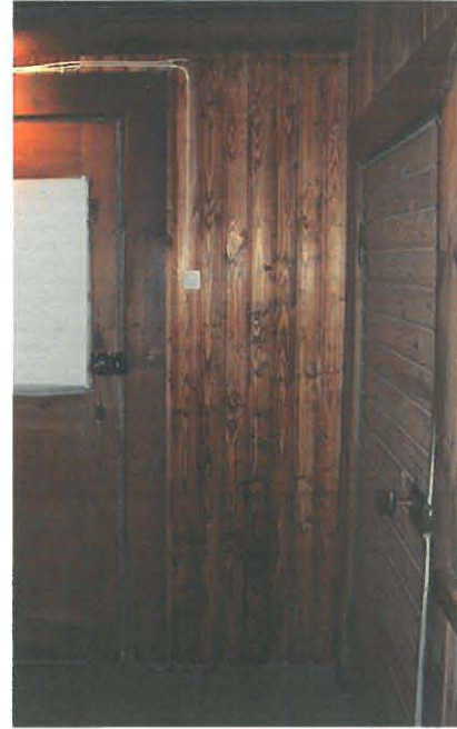
Yksi kerros petsiä