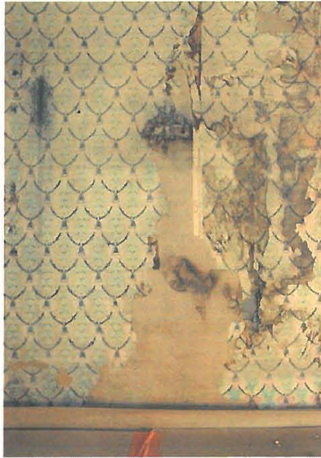
Luoteen puoleisen seinän vaurio, reunat suoristettu ja kiinnitetty

repeämät paikattiin japaninpaperilla. Paikkaukset retusoiitiin tapetin kuvion mukaan tehtyjen sabluunoiden avulla. Retusointiin käytettiin vesivärejä (St. Petersburg) ja paikoitellen myös pastelliliituja (Rembrant).