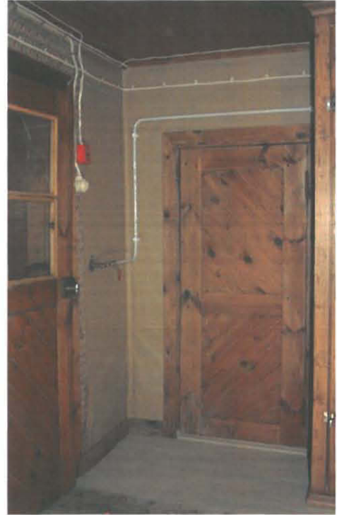
Nurkka uuden pahvituksen jälkeen

Huoneeseen rakennettu uusi sähkökaappi käsiteltiin kolmeen kertaan Osmo® colorin läpikuultavalla puuvahalla, sävy 3143 Konjakkii.