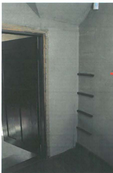
Nurkka kosteusvaurion peittämisen jälkeen