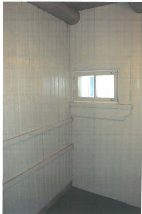
Seinät ja lattia maalattu

Ruokakomeron lattia maalattiin tummanruskealla öljymaalilla (SAX Saxotol), jonka sävy valittiin keittiön porstuan lattiasta (sävy NCS S 8010-Y50R). Ennen maalausta käsittelemätön lattia puhdistettiin kristallisoodalla. Maalaus tehtiin kolminkertaisena ja pinta hiottiin kevyesti jokaisen maalauskerran välissä.