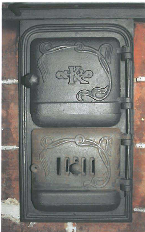
Alempi uuninluukku osittain käsittelemättä