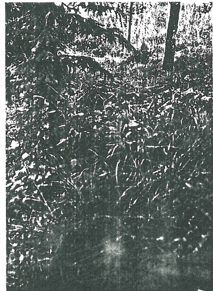
TYA 11573 Hajalöydön löytökohta, taustalla hämmentää J. Kannon kesämökkiä ja Kattelianlahtea