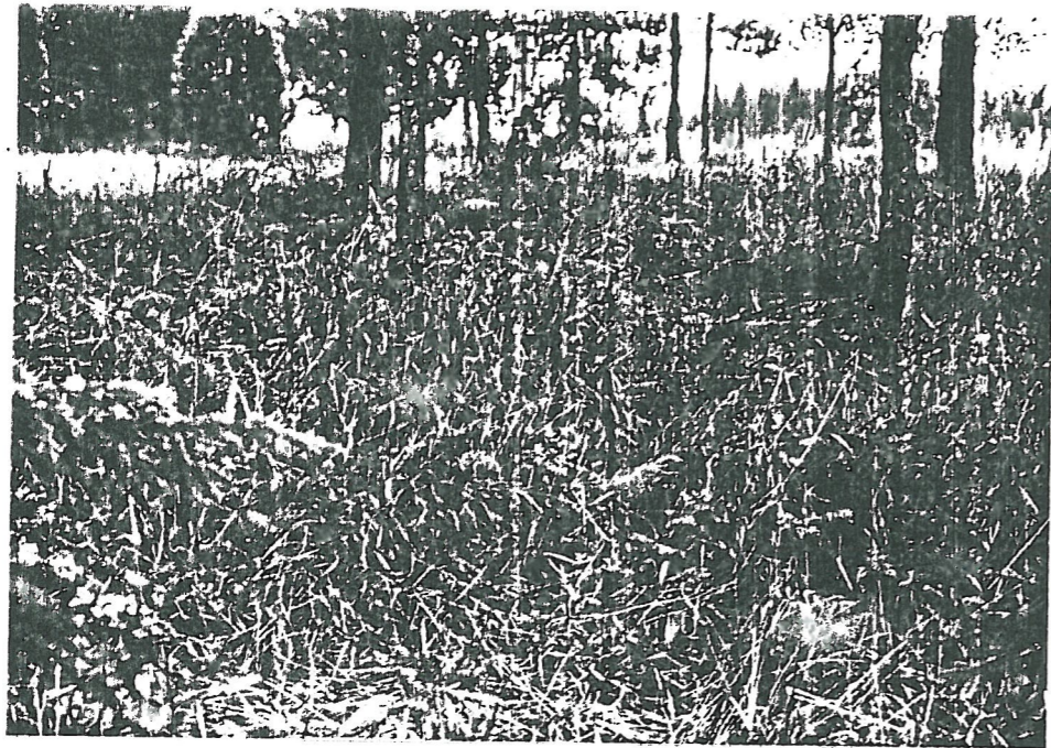
TYA 11572 Hajalöydön löytökohta ja tasannetta, kuv. SE

TYA 11570-11571 Panoraama: Kuvasarjan vasemman puoleisimmassa reunassa nuolen I osoittamassa kohdassa muinaisjäännoksen, Tonttimäen kalmiston, kuvasarjan oikean puolisimenassa reunassa, kuv. NNE-SE