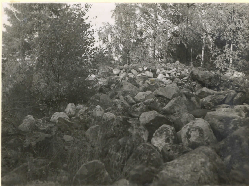
Lev. 15368. Sauvo, Ylirist- niemi, Välikankareen tu- hottu pronssikautinen hautausraunio. J. Leppä- aho 1949.