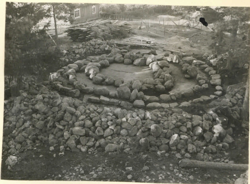
Ler. 15363. Sälvo, Yliristnie- mi, Pellonpää.