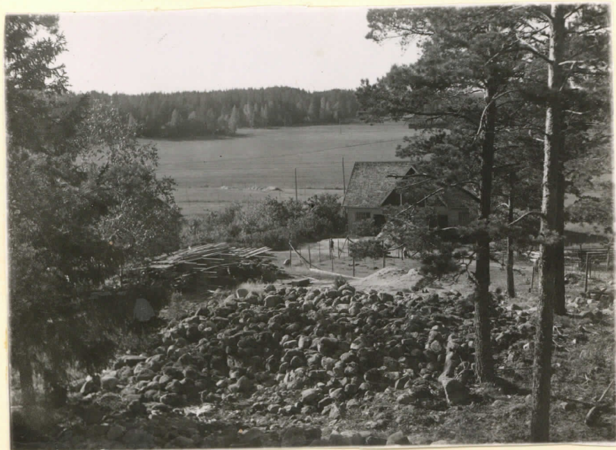
Lev. 15360. Suunta kutakuin- kin etelä. J. Leppäaho 1949.