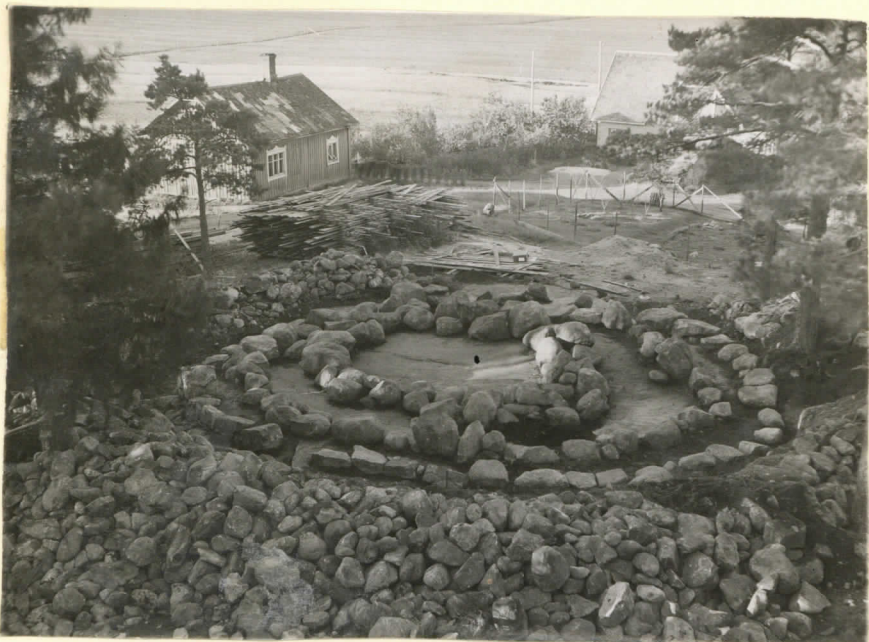
Ler. 15364. Preussikautinen hau- tama tutkimisen jälkeen.