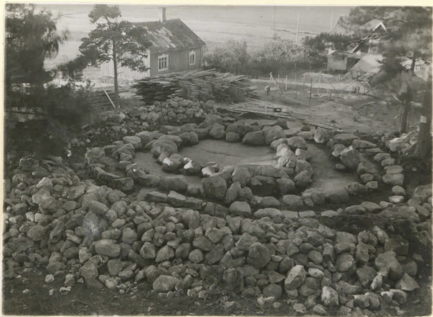
Ler. 15365. Valokuvauksessa unta mittei länsi. J. Leppäaho 1949.