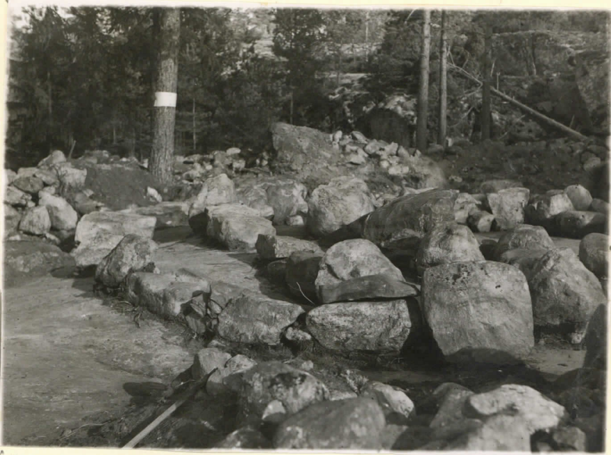
Ler. 15366. Sauvo, Ylirist- niemi. Pronssikautisen hau- tarauunion ulkokehä. Suunta pohjoinen. J. Leppäaho 1949. (Pellonpää)