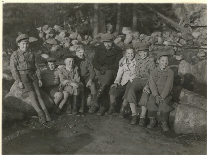
Lev. 19362. Sauvo, Ylirist- niemi, Pellonpää. Yliopp. E. Hukkinen ja kaivajia. J. Leppäaho 1949.