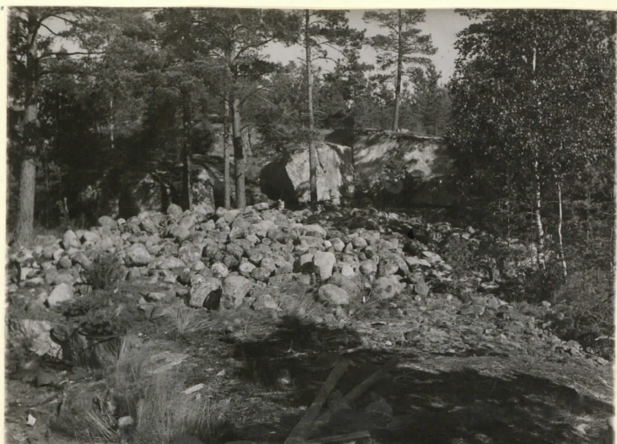
Lev. 15361. Sauvo, Yliristnie- mi, Pellonpää. Pronssikauti- nen hautausraunio ennen kaivauksia. Valok. suunta. pohj. keillinen. J. Leppäaho 1949.