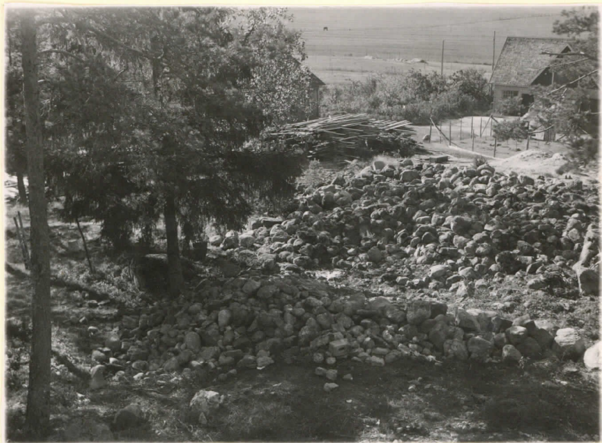
Lev. 15359. Sauvo unio ennen tutkimista. Valokuvauk-