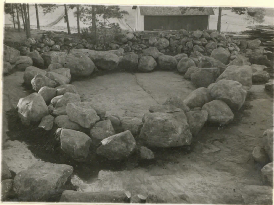
Ler. 15367. Sauvo, Ylirist- niemi. Sisäkehä. Suunta etelä. J. Leppäaho 1949. (Pellonpää).