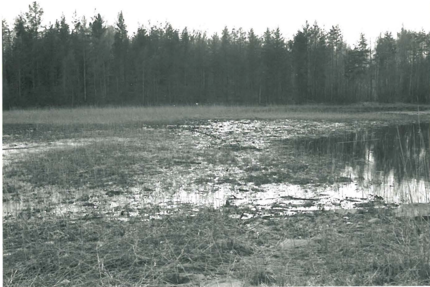
Kuva 1. Liistekatiskat lahden suulla. NE-SW. 18.5.2003 (21160: 507).