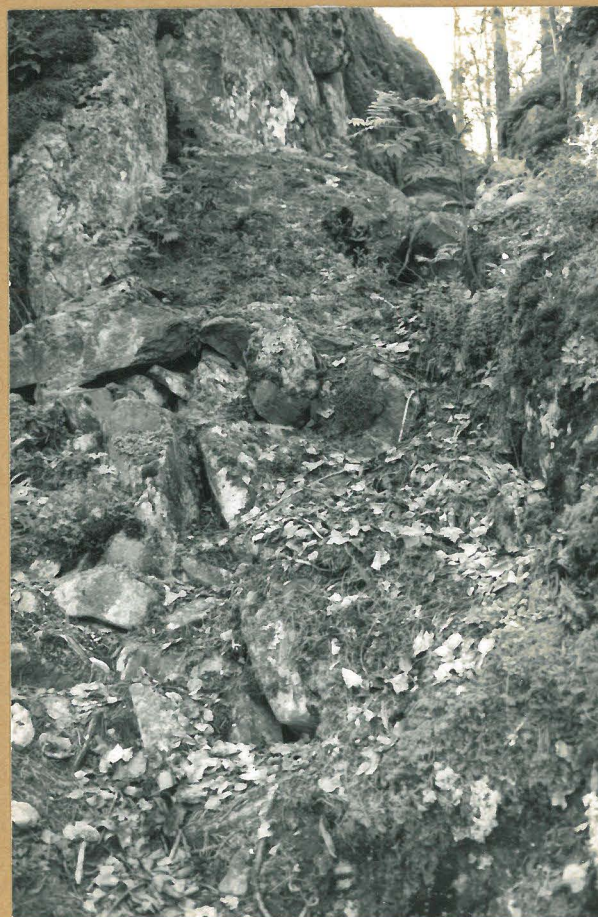
Kuva 2: Linnavuoren pohjoispuolella olevaa kapeaa käytävää. Kuvattu rinneeltä käytävää ylöspäin.