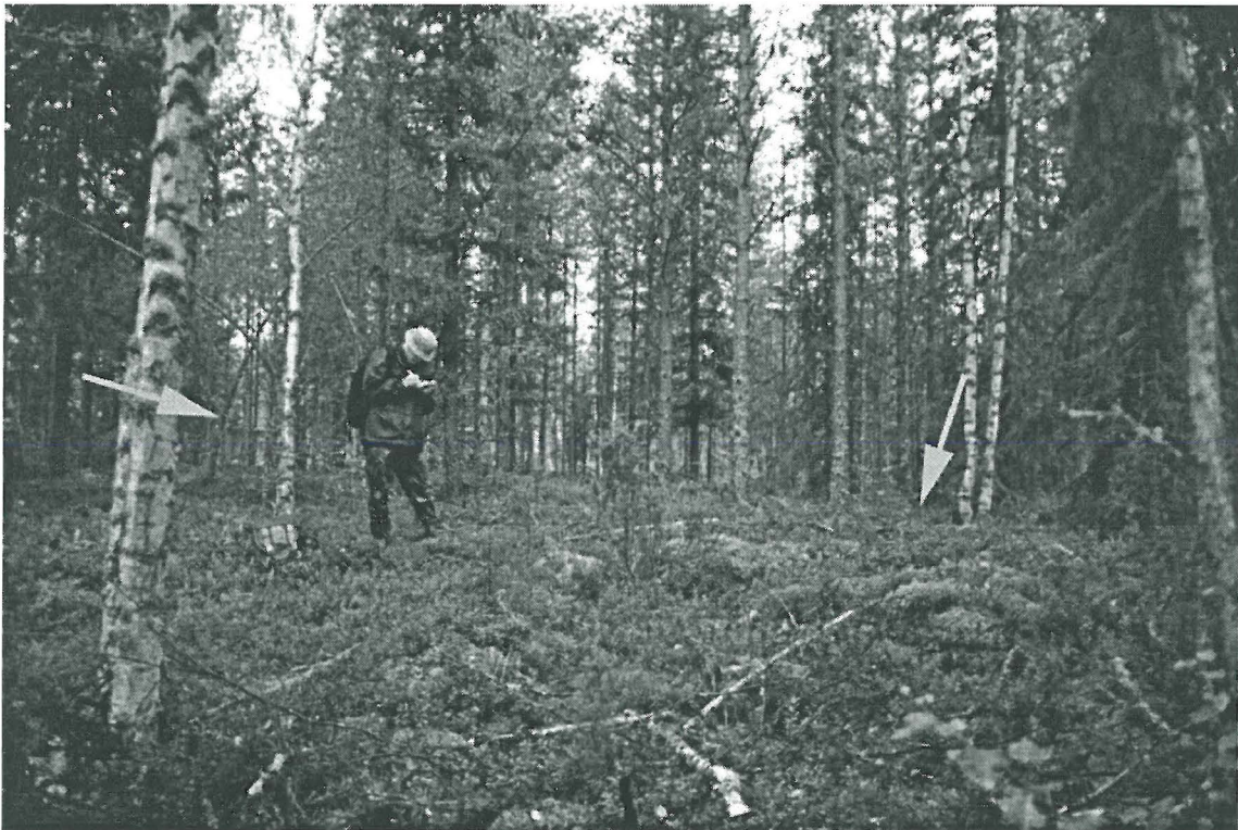
Kuva 2. Oulu Oulunsuu Vehkakangas. Röykkiötä (oikea nuoli) dokumentoimassa FL Jari Okkonen. Taustalla (vasen nuoli) hämmöttää Vehkakankaan ainoa asuinrakennus.