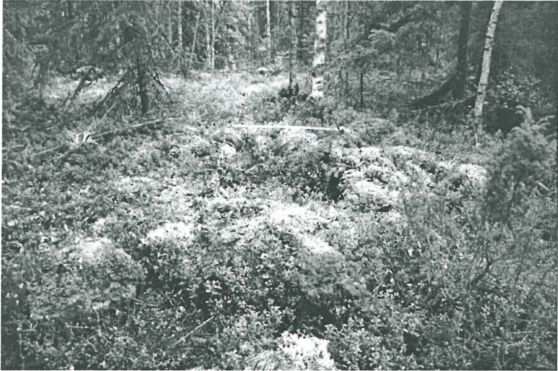
Kuva 1. Oulu Oulunsuu Vehkakangas. Lähes kokonaan sammaleen peittämä röykkiö.