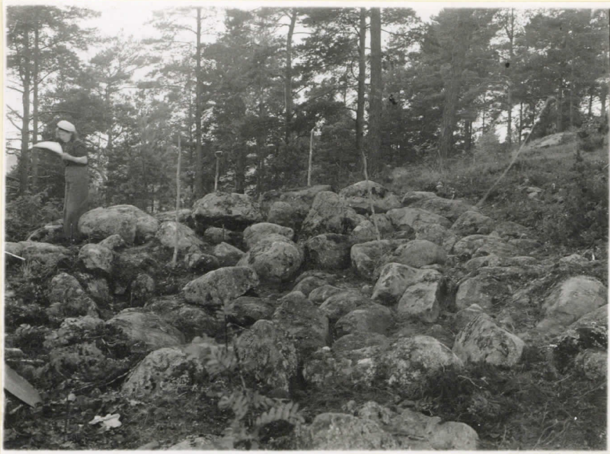
L. 13566. Røykiön NW-osa paljas- tettuna. Kuva O:sta päin.