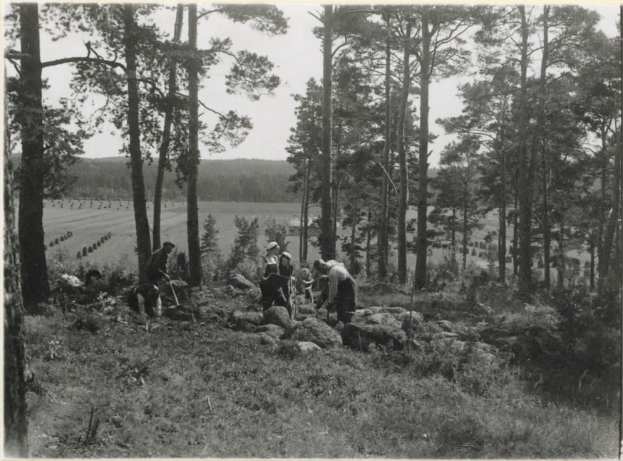
L.13565. Roykkiö osaksi paljastettu- na.