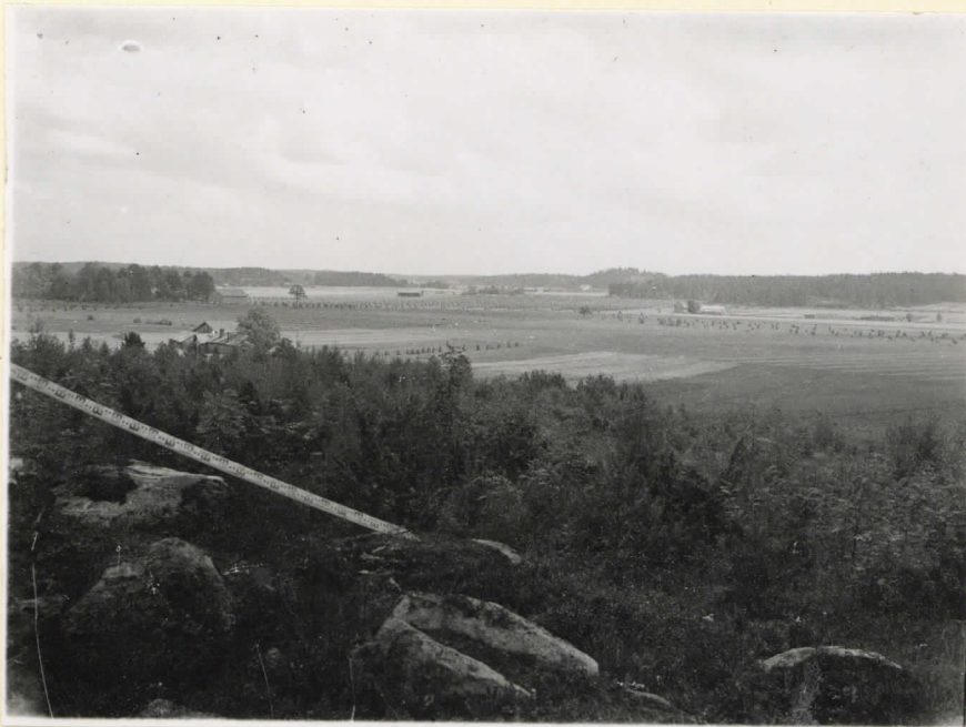
L. 13567. Näköala kaivauspaikalta. Taustalla korkeampi kohta Liedon Vanhalinna.