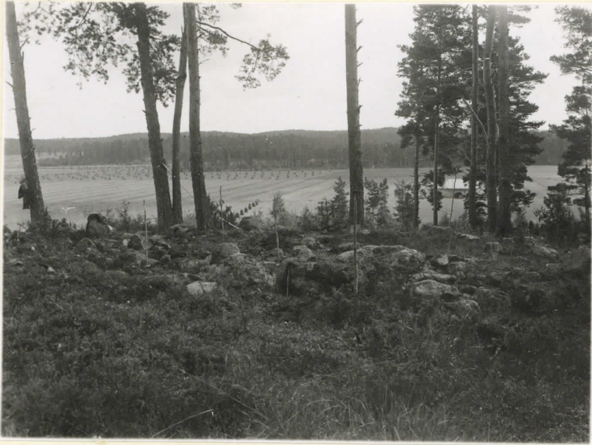
L.13564. Roykkiö osaksi paljastettu- na. Valok. NW:stä.