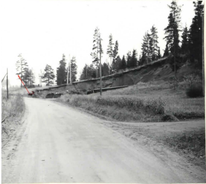
Santa haudan mäki kuvattuna pohjoisesta. Ruuomishaudat muuten osoittamalla hakelalla.