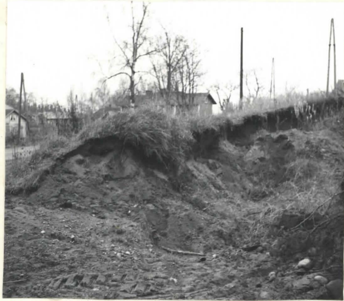
Rautabautisten esineiden, KM 15444 ja 15463 täyttöpaikkaa