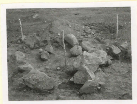
Rannio A tutkittuna, polyjalivat paikoillaan, kuvattu luoteesta.