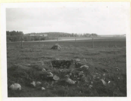
Rannio A ennen kaivamista pohjoisesta päin.