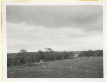
Yleiskuva KIRSTULAN rantakalmistosta lännestä päin. Vasemmalla rannio B, oikealla edessä rannio A ja sen takana rannio C, keskellä uhrihiiri.