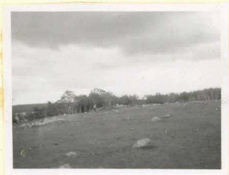
Yleiskuva KIRSTULAN rantakalmistosta lännestä päin. Vasemmalla peltorauunis, taustalla keskellä rannio B ja oikealla rannio A. Niiden välistä näänvöittävä rannio C.