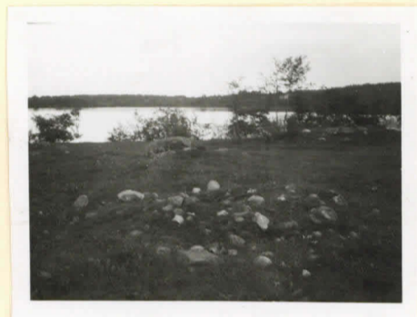
Rannio A ennen kaivamista etelästä päin kuvattuna.