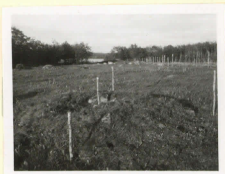
Rannio A ennen kaivamista lännestä kohti kuvattuna