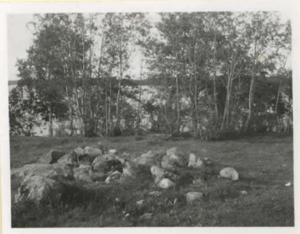
Peltorannio, kuvattu etelästä.