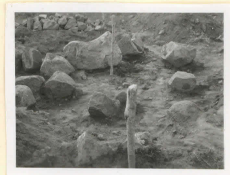
Rannio A haivettuna, polyjalivat paikoillaan. Kuvattu etelästä päin.