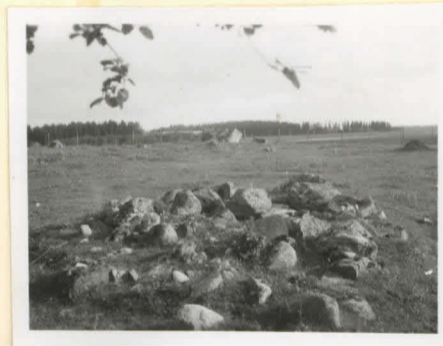
Peltorannio. Kuva otettu pohjoisesta kohti.