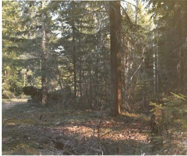
Kankaanlaidan kirkkoseutimen asuin- pihkan lännestä. Hiekkakumpu tien oikealla puolella tiheässä mätrikössä.