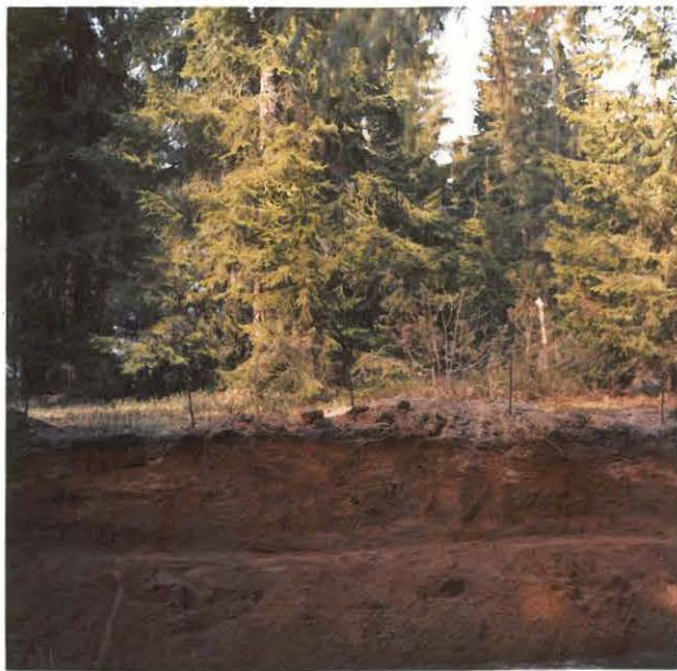
Profiilileikkaus tien eteläpuolelta, kuvaattu eteläpuolelta, kappelin etelä- lms.