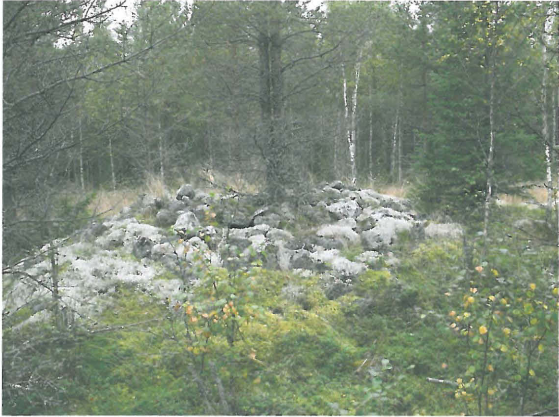
Kuva 1. Suurempi röykkiö.