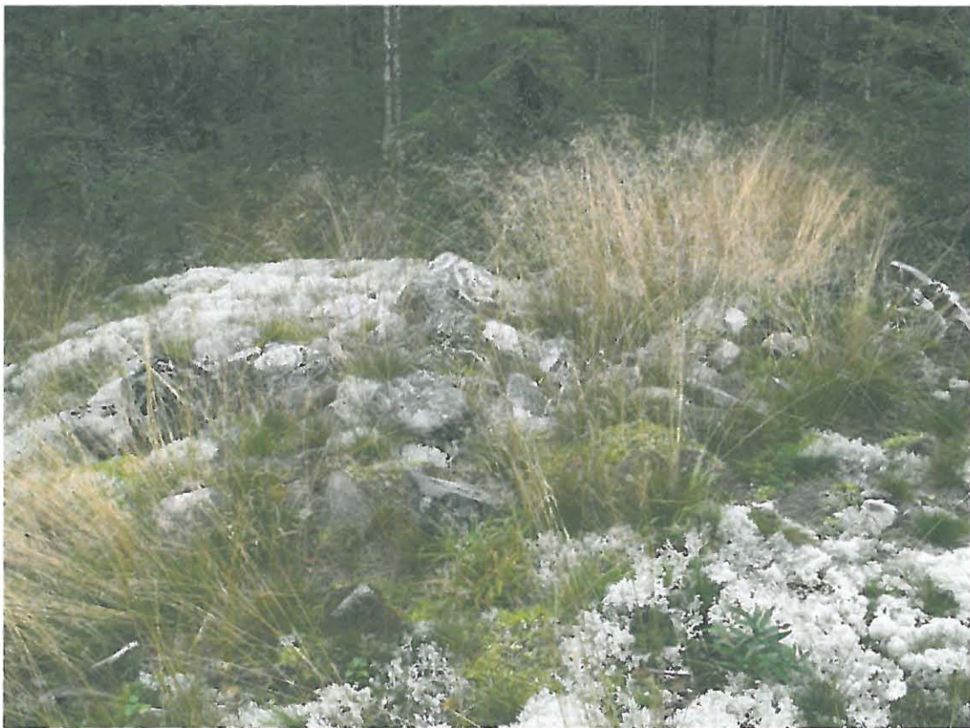
Kuva 4. Pienempi, epämääräisempi röykkiö.