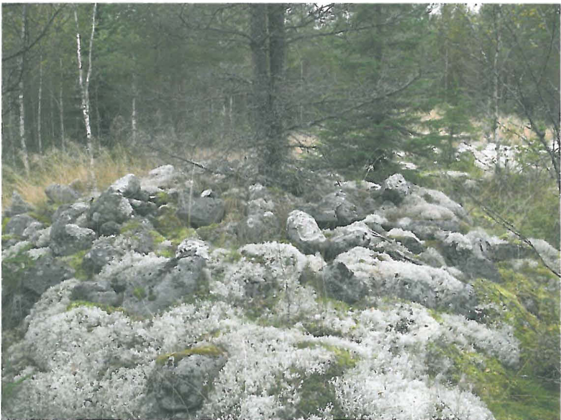
Kuva 2. Suurempi röykkiö.