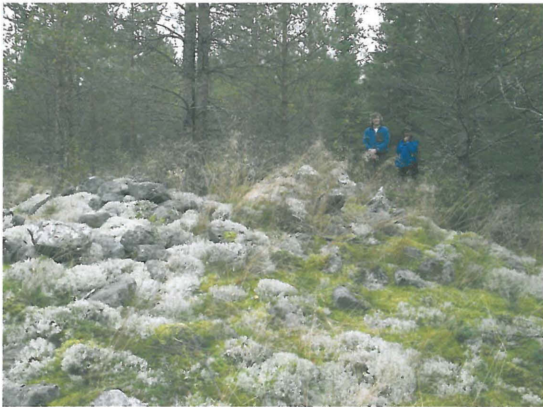
Kuva 3. Kuvassa Pentti Rislä ja Tuomo Uutio.