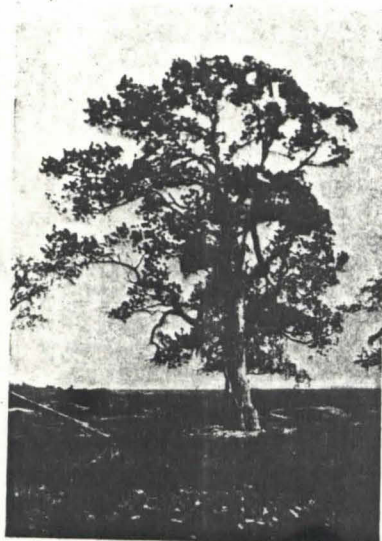
Kuva 25. Vanha uhriaihki Enontekiön entisen Markkinan hautausmaalla.