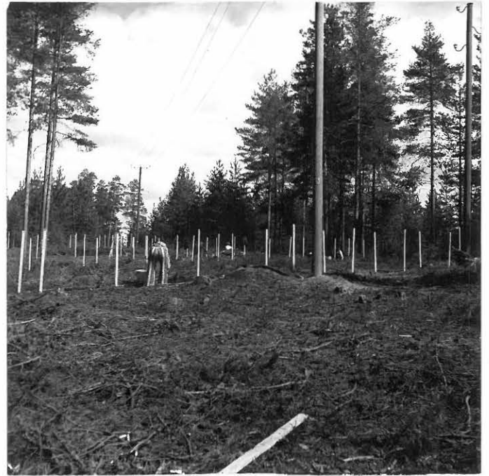
Kuva 2. Neg. 44036 Kaivausaluetta etelästä kuvattuina