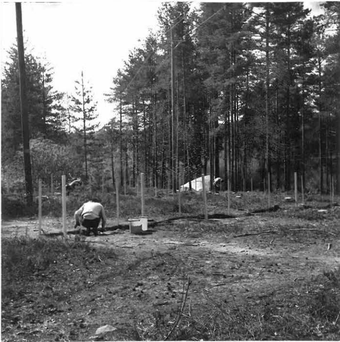
Kuva 1. Neg. 44035 Kaivausaluetta pohjoisesta kuvattuina.