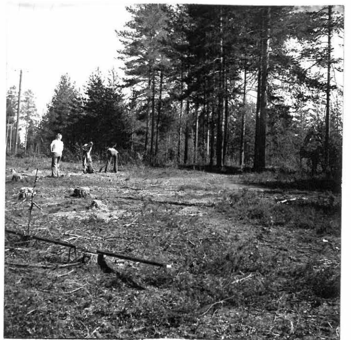
Kuva 4. Neg. 44038 Koeojia peitetään. Kuva etelästä