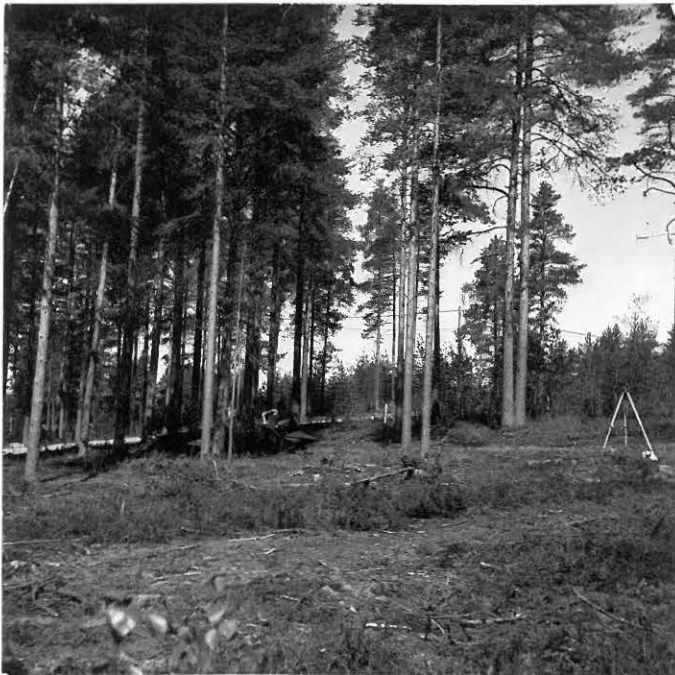
Kuva 3. Neg. 44037 Koeojia peitetään. Kuva kaakosta.