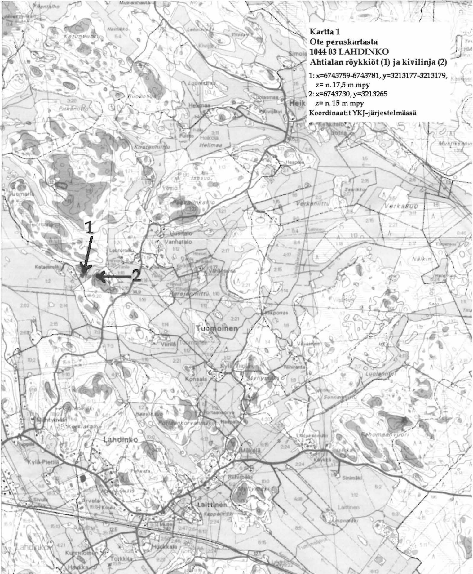
Kartta 1 Ote peruskartasta 1044 03 LAHDINKO Ahtialan röykkiöt (1) ja kivilinja (2) 1: x=6743759-6743781, y=3213177-3213179, z= n. 17,5 m mpy 2: x=6743730, y=3213265 z= n. 15 m mpy Koordinaatit YKJ-järjestelmässä