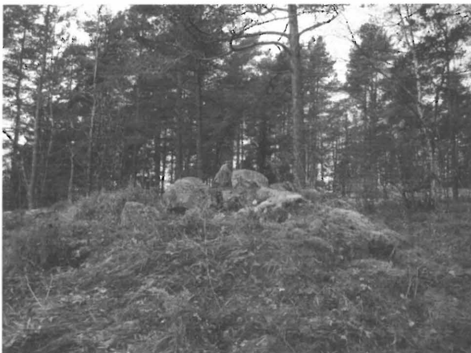
Kuva 1. Tuomarlan Ahtialan röykkiö 1, kaakosta. Röykkiön laella on hiljattain siirretyjä kiviä.

Kuvia Vehmaan Kotiseutuyhdistyksen inventointikurssilta 23.10.2004.