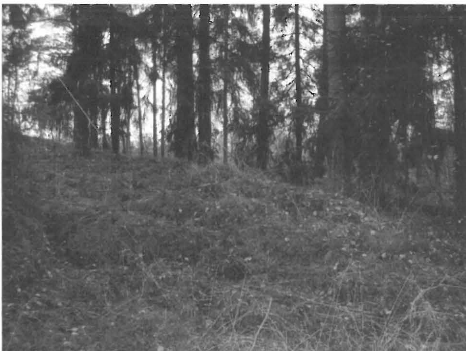
Kuva 2. Tuomarlan Ahtialan pohjoisempi röykkiö, etelästä.