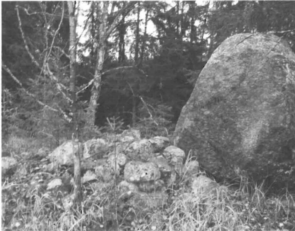
Kuva 5. Appuljärven luoteisranta, nelikulmainen kiveys, ehkä kiukaan pohja ja vieressä myöhemmin paikalle vieritetty irtolohkare, lännestä..