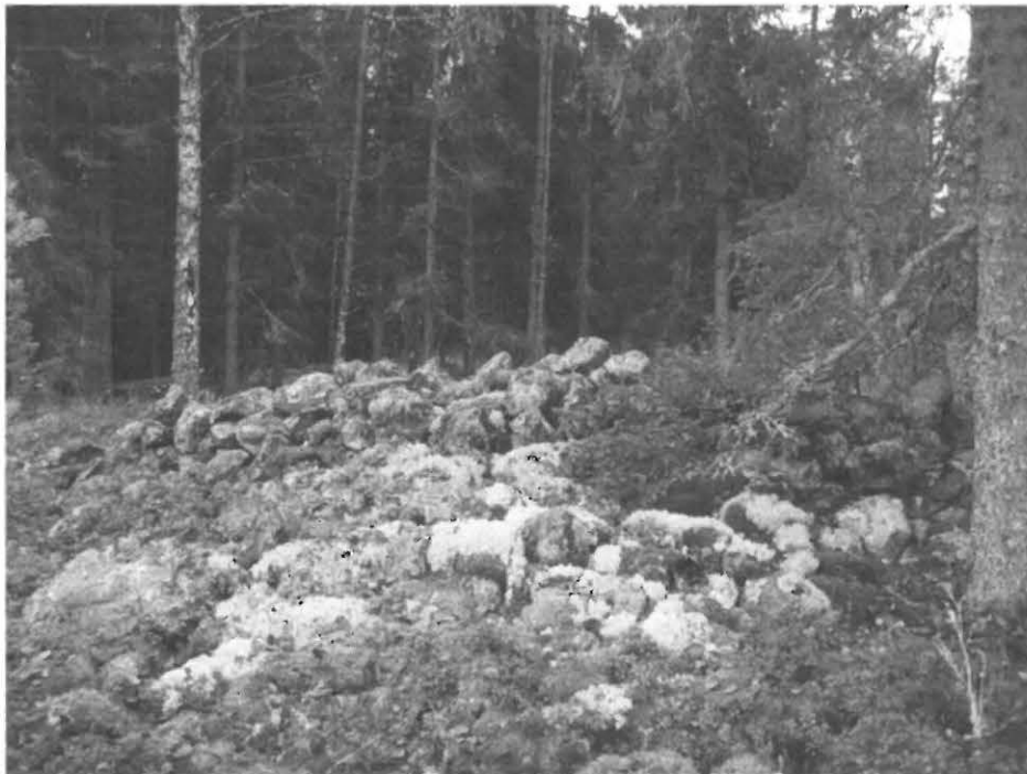
Kuva 4. Appuljärven luoteisrannan röykkiön puolikas kiviaidan alla, pohjoisesta.