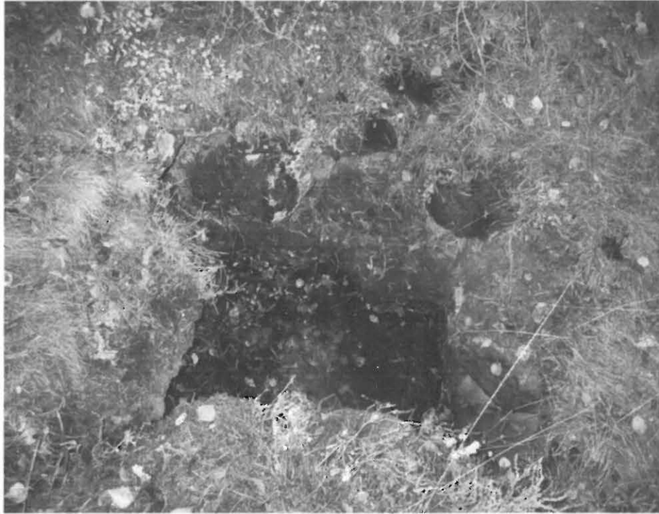
Kuva 3. Ahtialan röykkiöiden välialueella sijainnut kaivettu kuoppa.