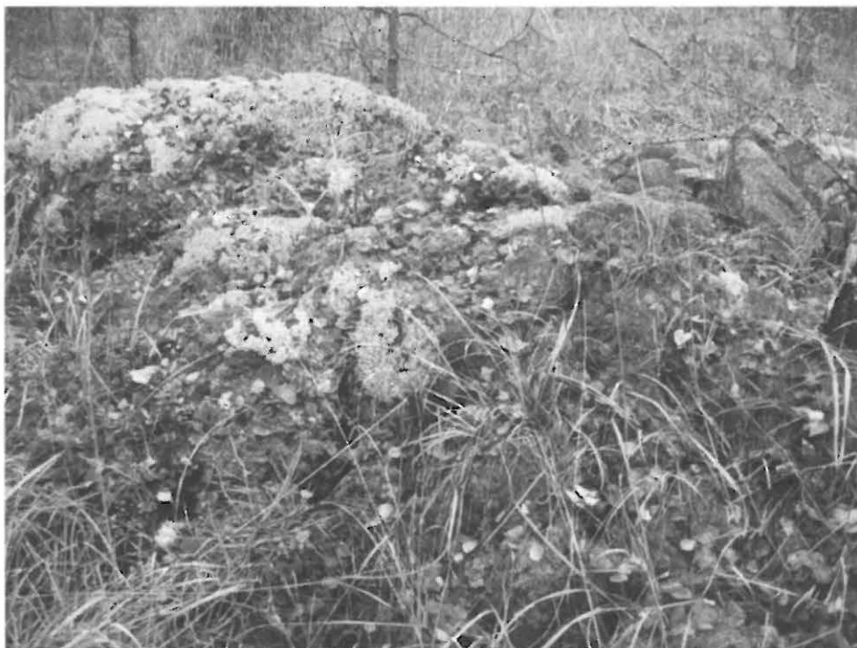
Kuva 6. Pieni silmäkivellinen röykkiö Kopparvareen suurröykkiöalueen eteläpuolella, idästä.