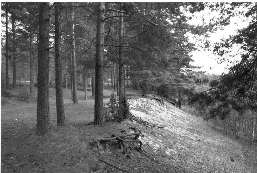
(Neg. 131593) Pistohiekka A. Asuinpaikan länsipäätä. Kvartsien löytöpaikka hiekkatörmässä. Lännestä.