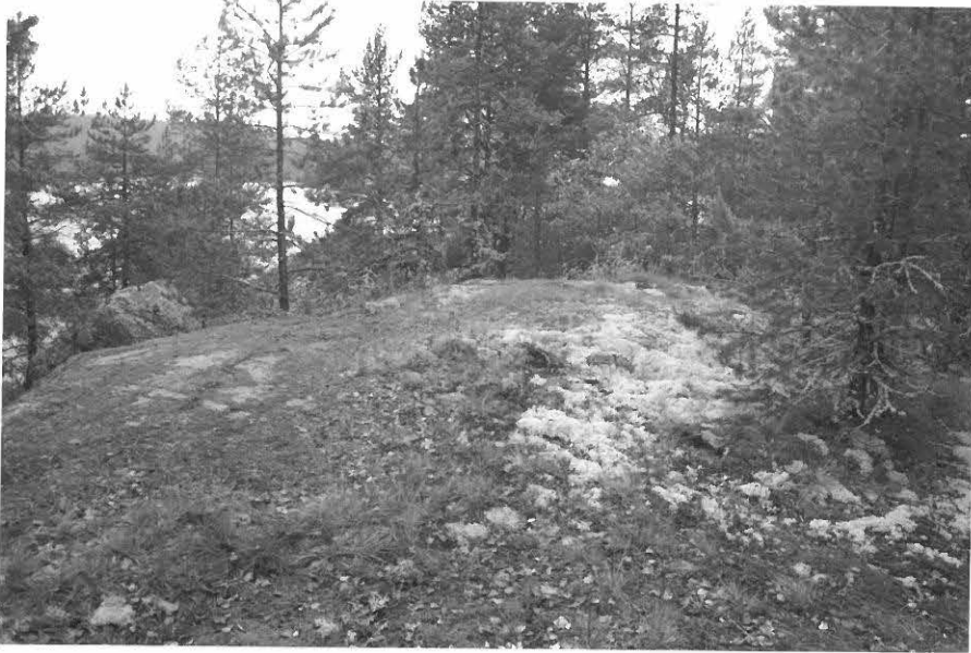
(Neg. 131583) Pistohiekan lapinraunio. Idästä.