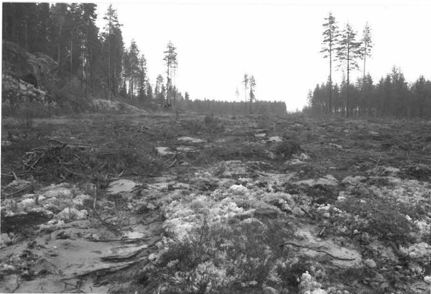
(Neg. 131582) Pistohiekka A, laikutettua muinais- jäännösalueetta. Etelästä.