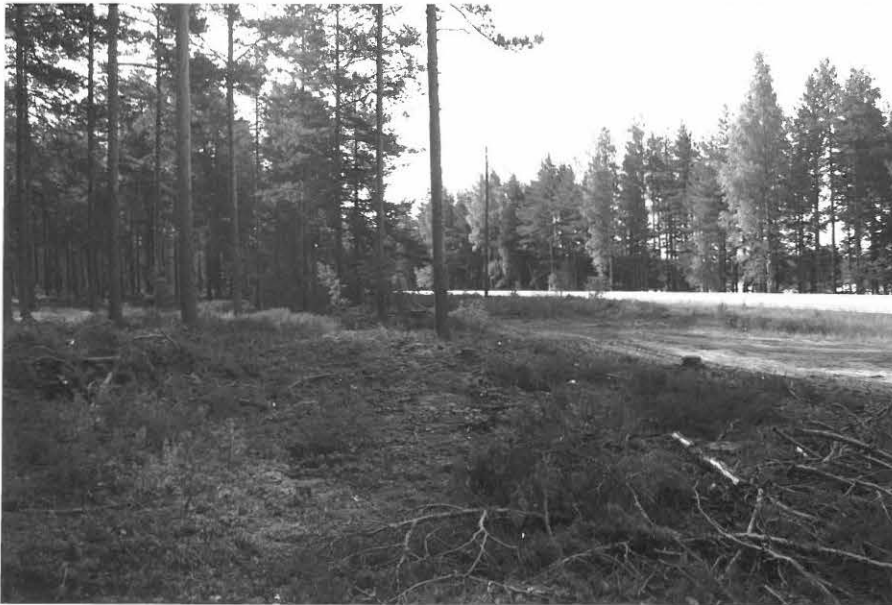
(Neg. 131594)Pistohiekka A. Asuinpaikan länsireunaa. Koe- kuopan paikka etualan risuka- san takana. Luoteesta.