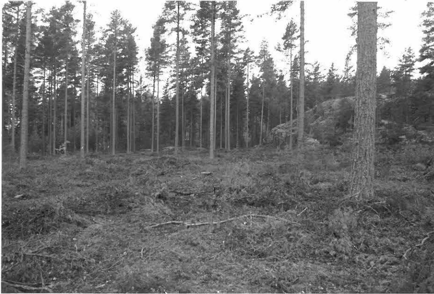
(Neg. 131592) Pistohiekka A. Asuinpainanne kallion kärjessä. Koillisesta.