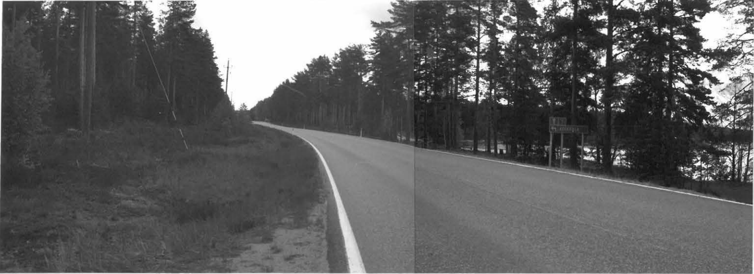
(Neg. 131586, 131587)Panoraama. Pistohiekka A asuinpaikka tien molemmin puolin. Taustalla Pistohiekanselkä. Luoteesta.