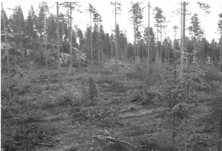
(Neg. 131591) Pistohiekka A:n eteläosaa. Kuvan keskellä asuinpainanne. Luoteesta.