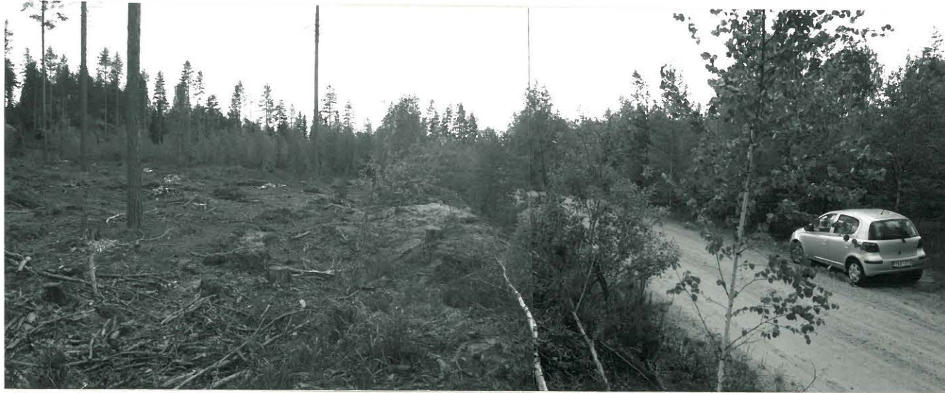
(Neg. 131584, 131585) Panoraama. Pistohiekka B. Asuinpaikka tien molemmin puolin. Koillisesta.