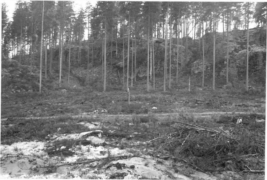
(Neg. 131581) Pistohiekka A, asuinpainanne ja sen opastaulu. Idästä.