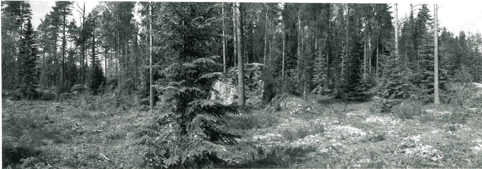
(Neg. 131589, 131590) Umpilampi. Asuinpaikka siirtolohkareen takana. Kaakosta.