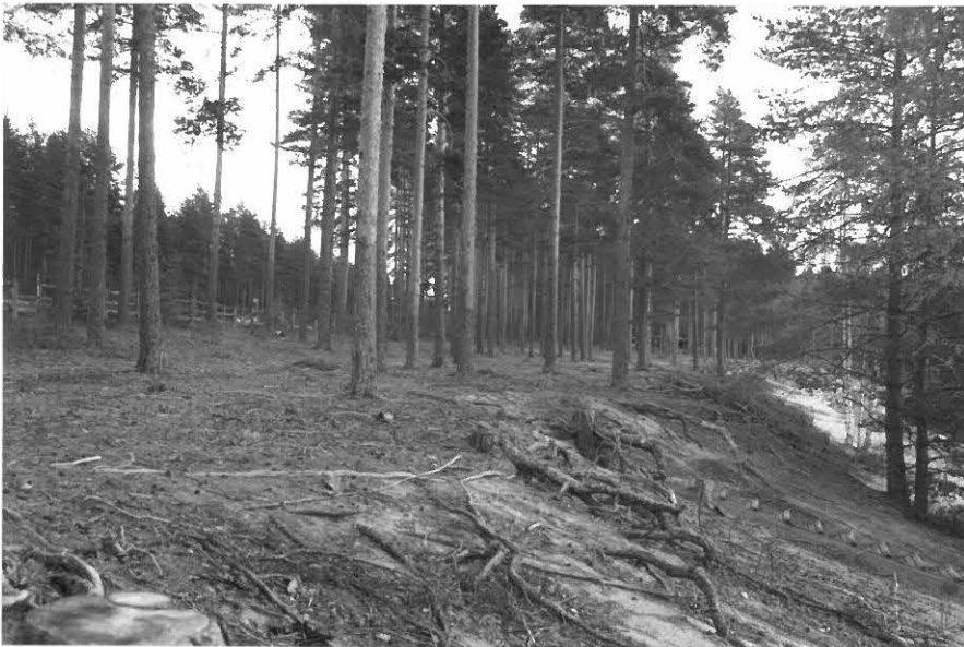
(Neg. 131588) Pistohiekka A. Asuinpaikka rantatörmällä. Kvartsien löytöpaikka hiekkatörmässä. Lännestä.