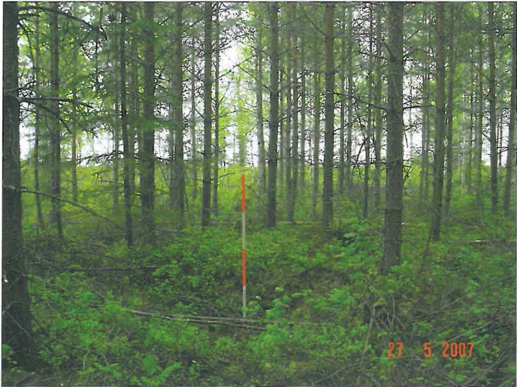
Hiilimiilun jääne C