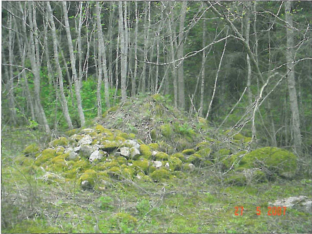
Viljelyröykkiö A (2)