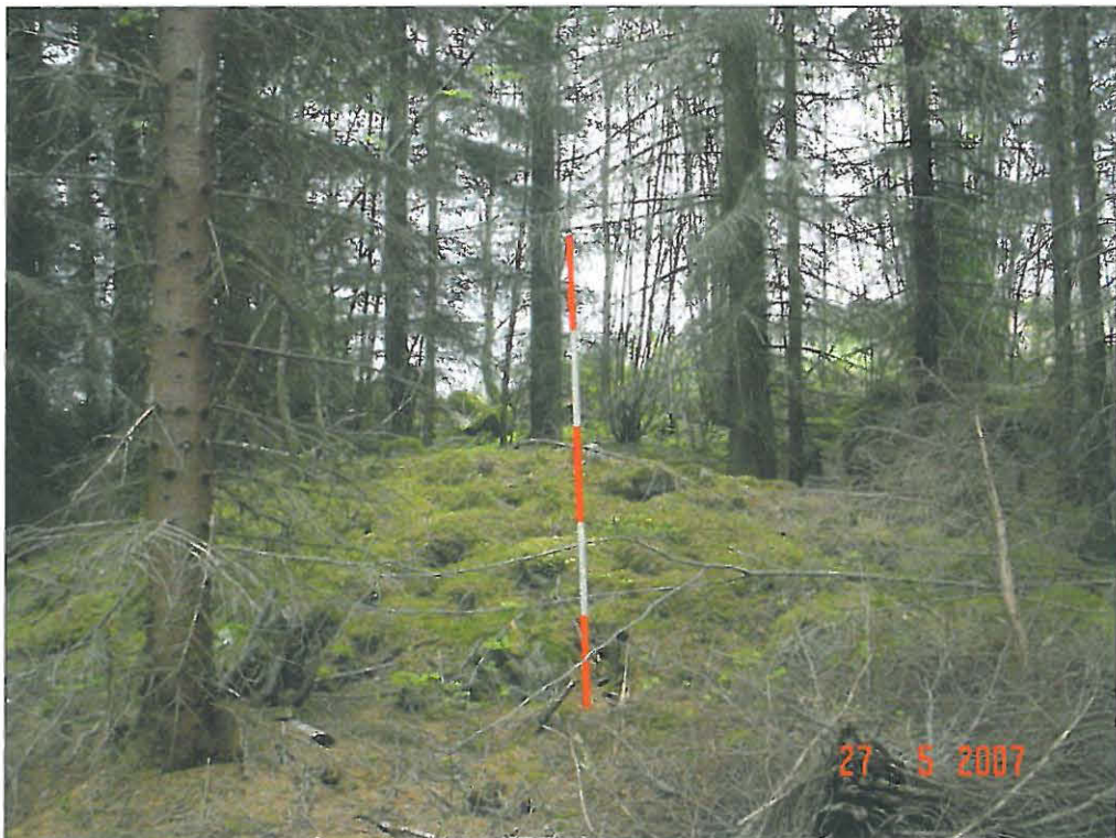
Viljelyröykkiö B (2)