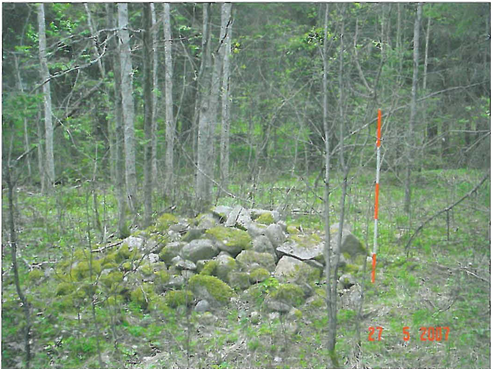
Viljelyröykkiö A (3)