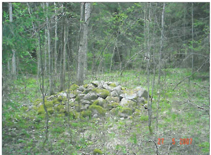
Viljelyröykkiö A (1)