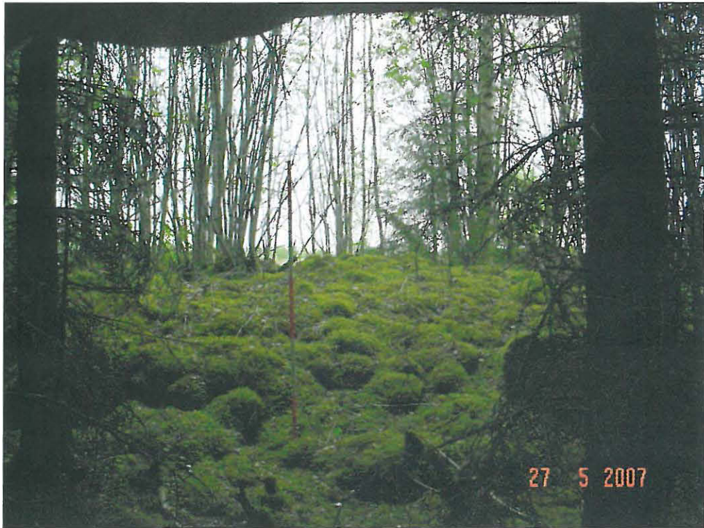
Viljelyröykkiö B (1)