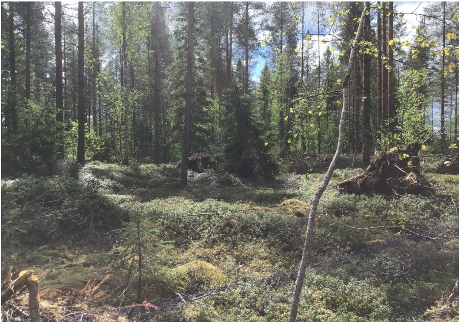
Kuva 3. Alakohteen kaksoisasumuspainanne luoteesta.