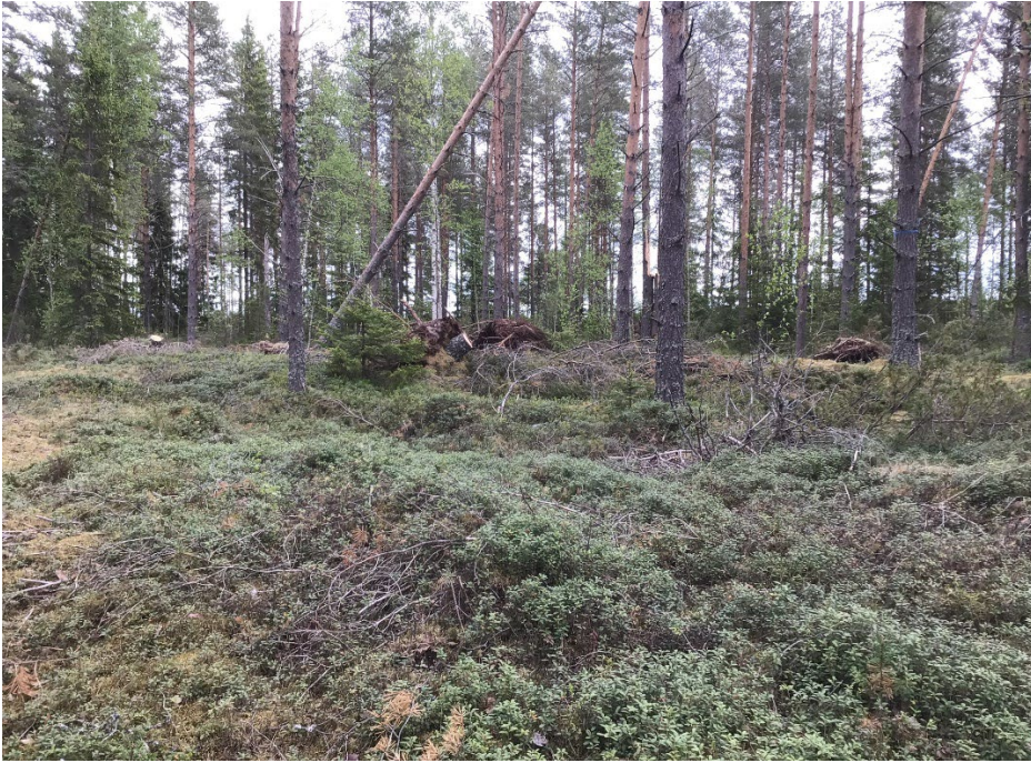
Kuva 2. Pääkohteen asumuspainanne lounaasta.