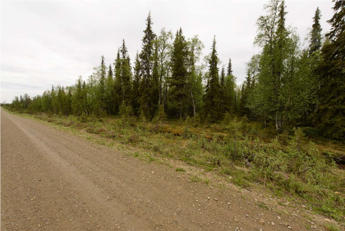
Suunnitellun Tiira louhoksen paikka Outa Perttusen tien länsipuolella. Kuvattu pohjoisesta. (DG3710:5)