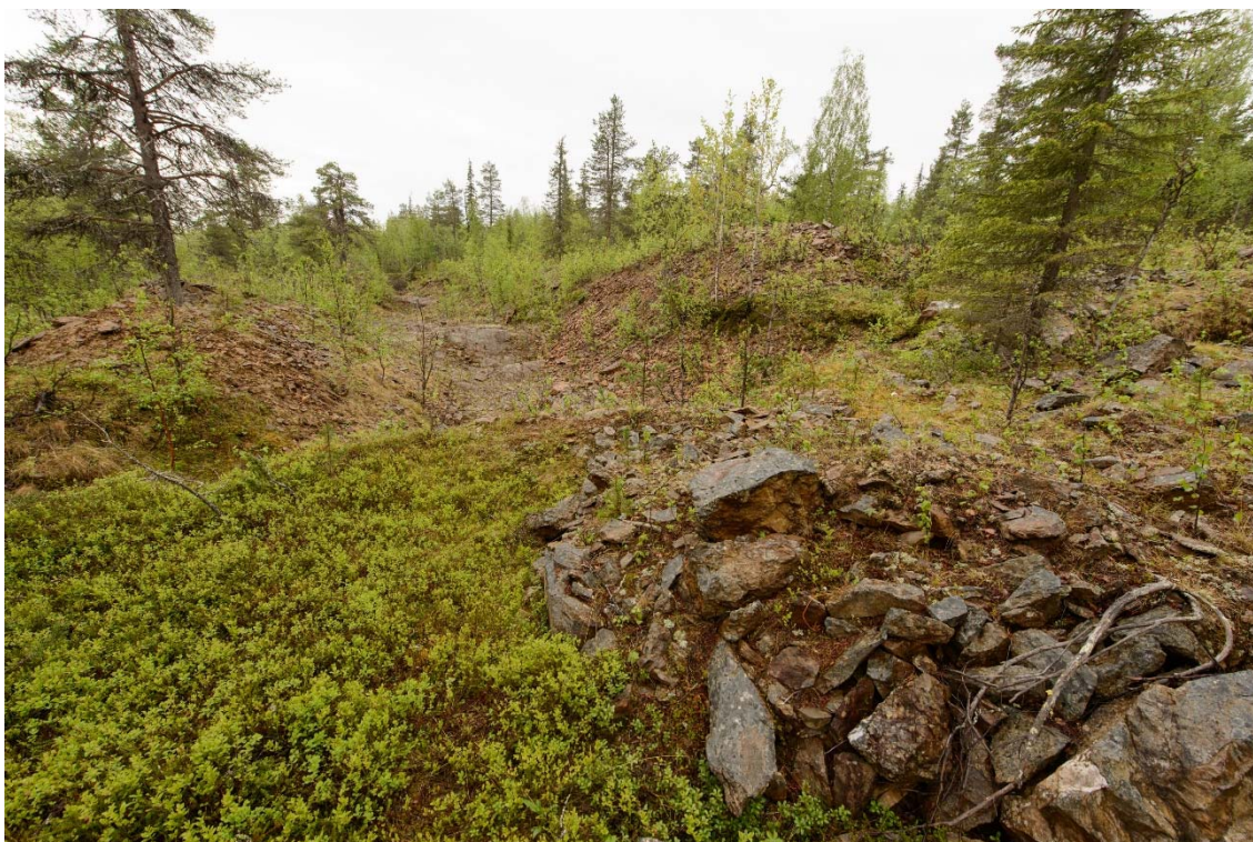
Kuotkon vanhaa louhosaluetta, jolle on suunniteltu Kati louhoksen paikkaa. Kuvattu idästä. (DG3710:2)