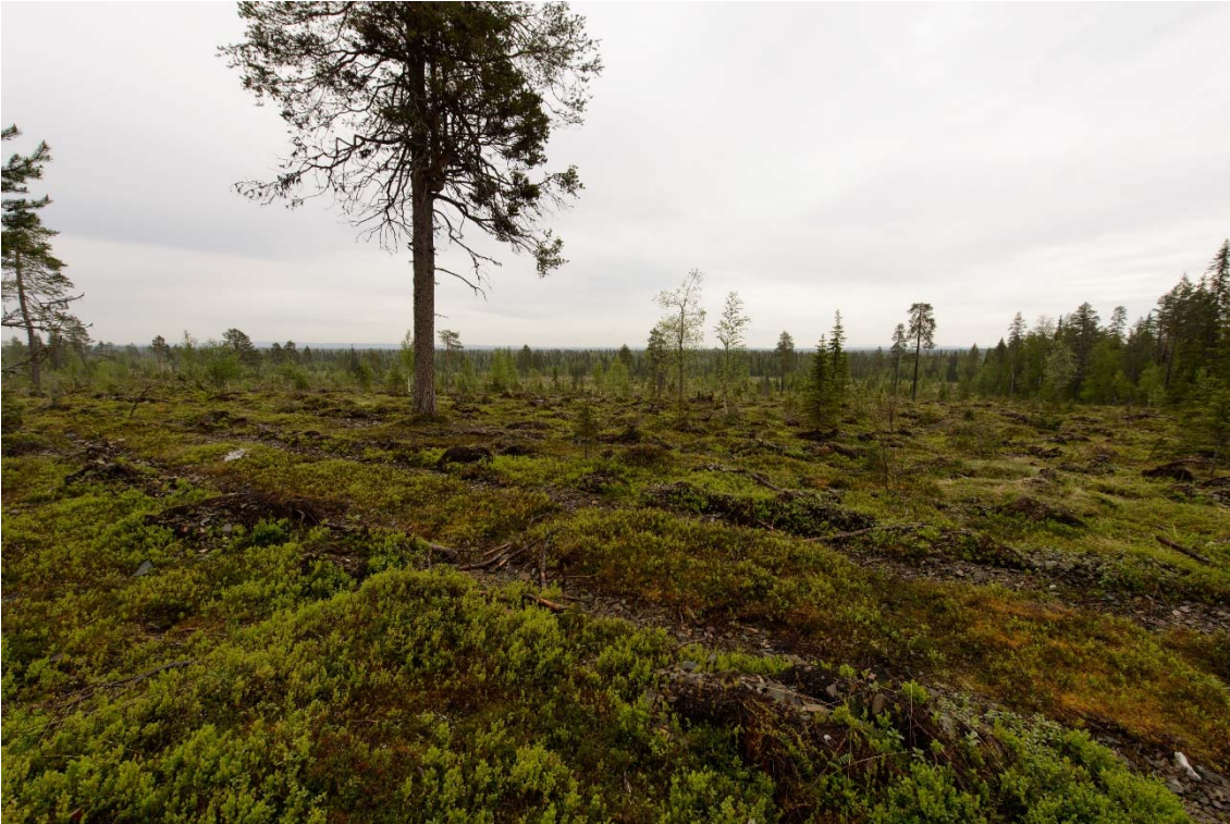
Maisemaa Iso Kuotkon eteläpuolella, johon on suunniteltu sivukiven läjitysalueita hankevaihtoehdossa 1. Kuvattu luoteesta. (DG3710:3)