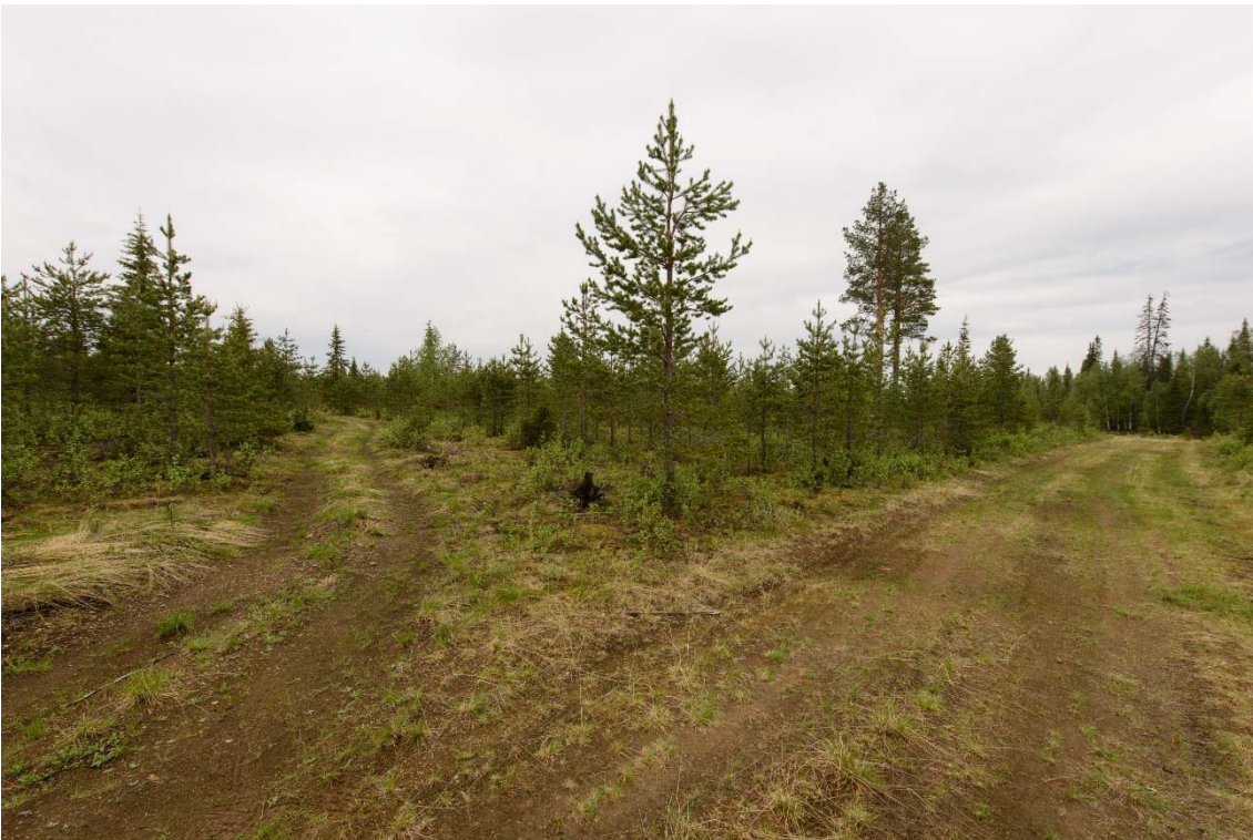
Aluetta suunnitellun Retu louhoksen kohdalla. Kuvattu lounaasta. (DG3710:4)