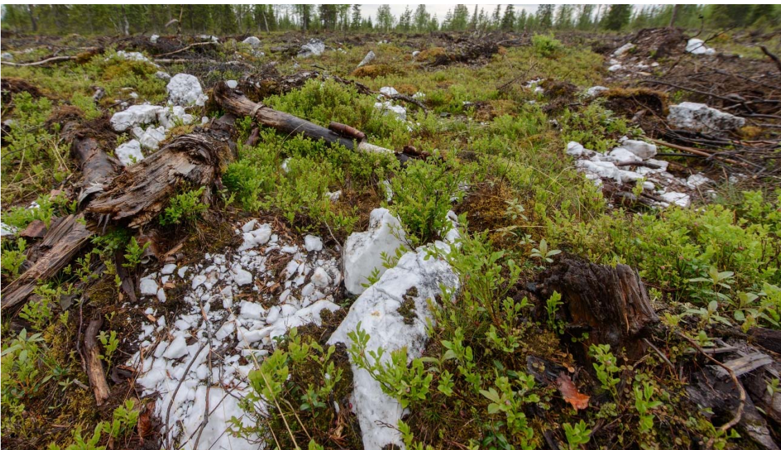
Äestyskoneen pirstomaa kvartssia vanhalle louhokselle johtavan tien eteläpuoleisella hakkuuaukealla. Kuvattu pohjoisesta. (DG3710:6)