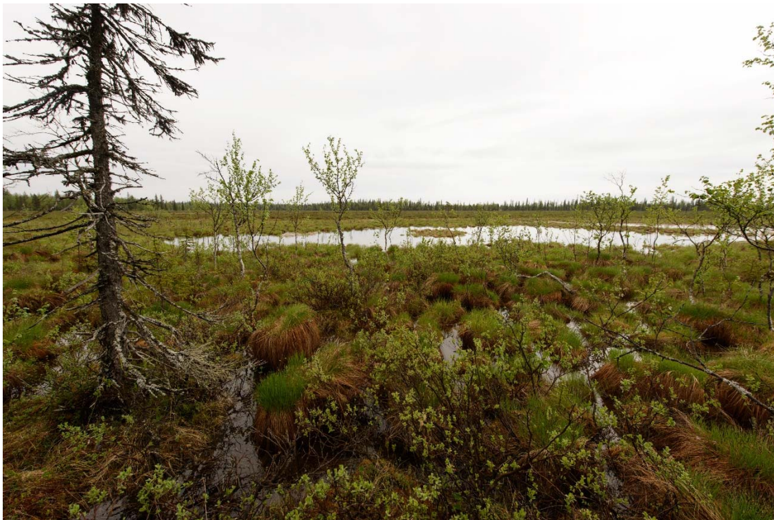
Lampi ja kosteikkoalue inventointialueen kaakkoisosassa, johon on suunniteltu sivukiven läjitysalue hankevaihtoehdossa 2. Kuvattu luoteesta. (DG3710:1)