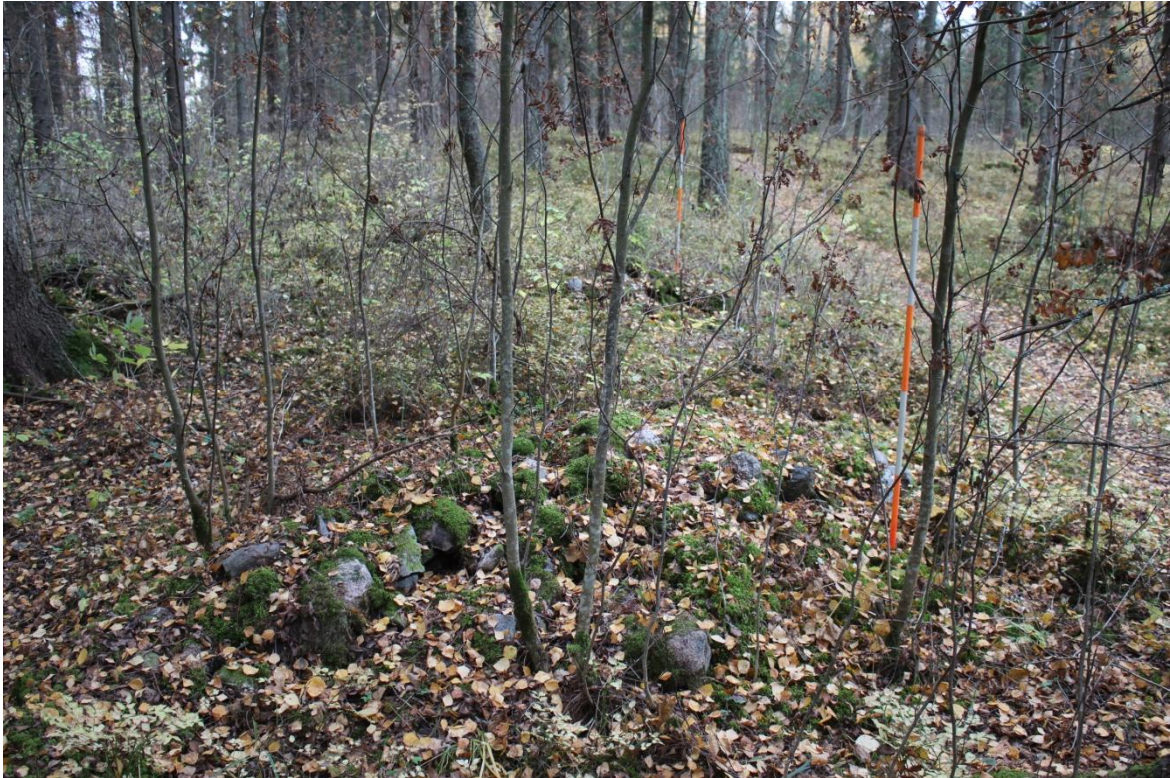
Kuva 1. Molempien linjaseipään vasemmalla puolella on rökkiö. Etualalla oleva rökkiö on venemäisen muotoinen. Kuvattu lounaaseen.