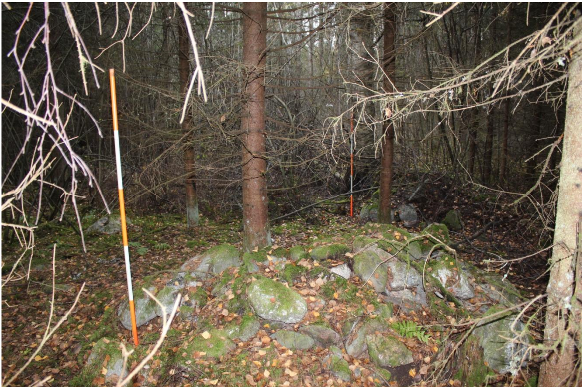
Kuva 2. Kuvan etualalla on miltei kolme metriä halkaisijaltaan oleva rökkiö. Taaempana on halkaisijaltaan pienempi, mutta korkeampi rökkiö. Kuvattu koilliseen.