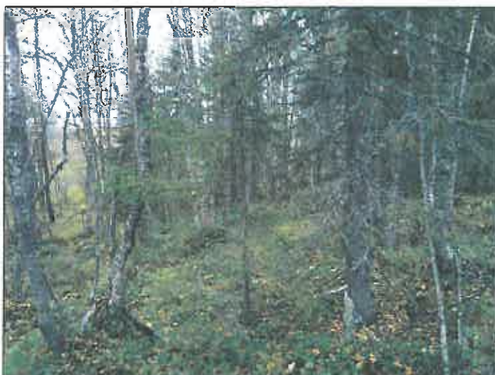
Vuostinmonjoen pohjoisranta linjan tuntumassa.