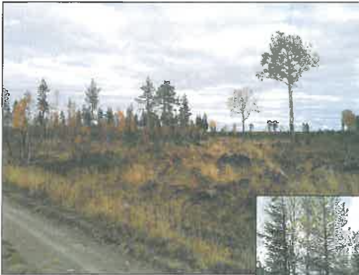
Yllä: linjan kaakkoispään maastoa