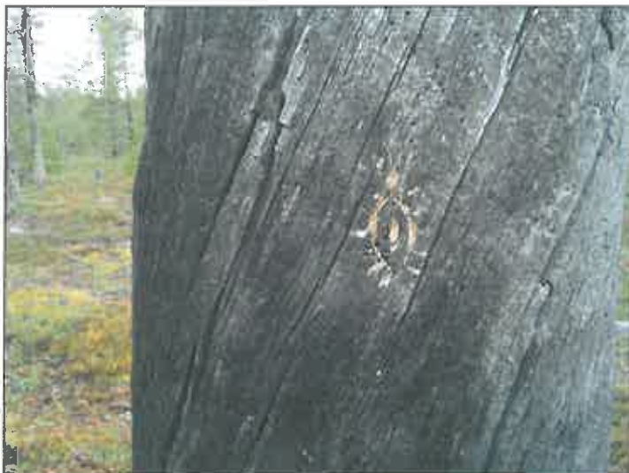
Pilkkapuu linjan luoteisosassa Kortteselän koillisreunalla.