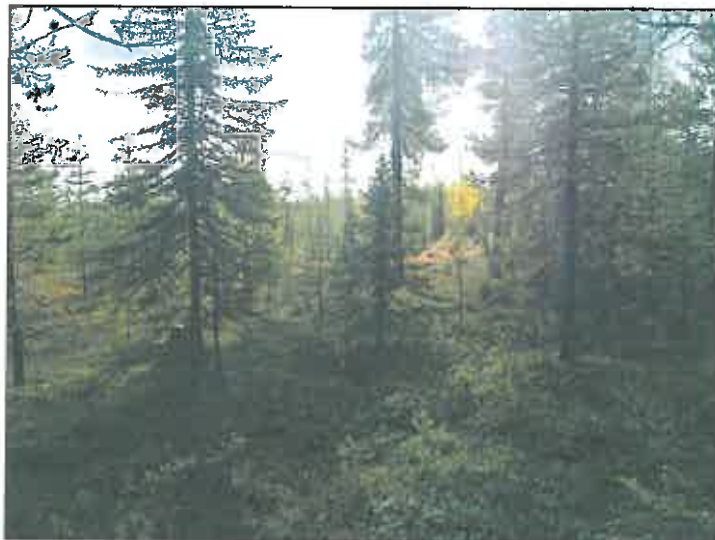
Linjan luoteispään maastoa Korteselän koillispuolella.