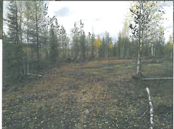
Oik: Kielimaa, linja kulkee kuvan kohdalla mäen reunaa suon rajalla.