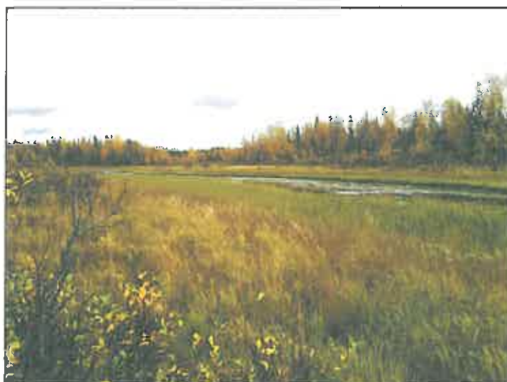
Vuostimonjoki kohdalla mistä linja sen ylittää.