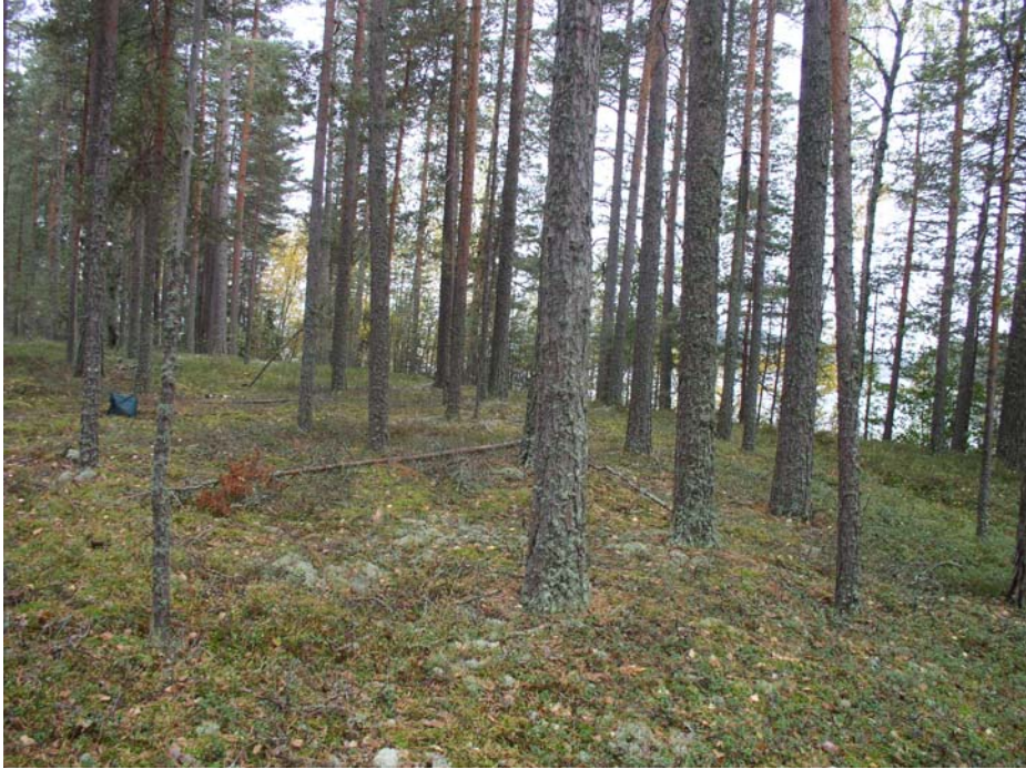
Lovalahdensalmi. Maastoa kuvattuna lounaaseen. Löytökohta kuvan vasemmassa laidassa karttalaikun kohdalla. Oikealla Vanosenjärven Isoselkä. Matala rantavalli kaartaa etualalta taustalle vasemmalle.