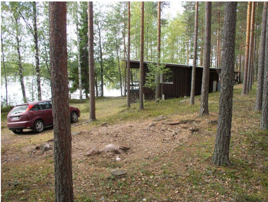
Jänislahti. Kuvassa on päällytöalueelta luoteeseen sijaitseva kesämökki. Etualalla on entisen ulkorakennuksen paikka, josta löytyi muutamia kvartsi-iskoksia (KM 36343:4). Taustalla näkyy Jänislahtea.