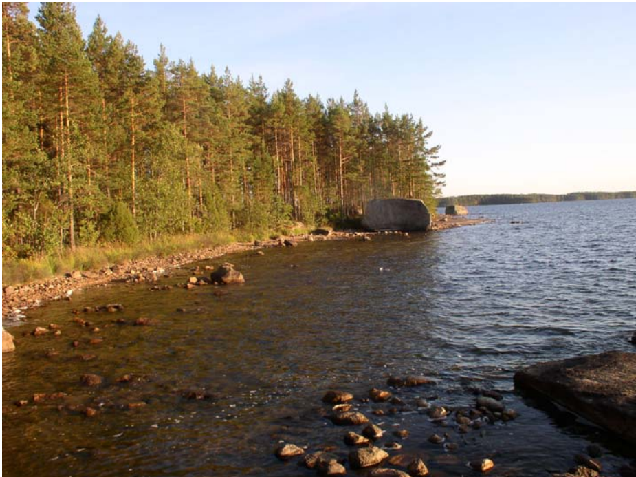
Latoniemi. Rantaa kuvattuna etelään. Pyyntikuoppa ja mahdollinen asuinpaikka ovat kuvan keskellä olevan suuren kiven takana, noin 30 m päässä siitä.