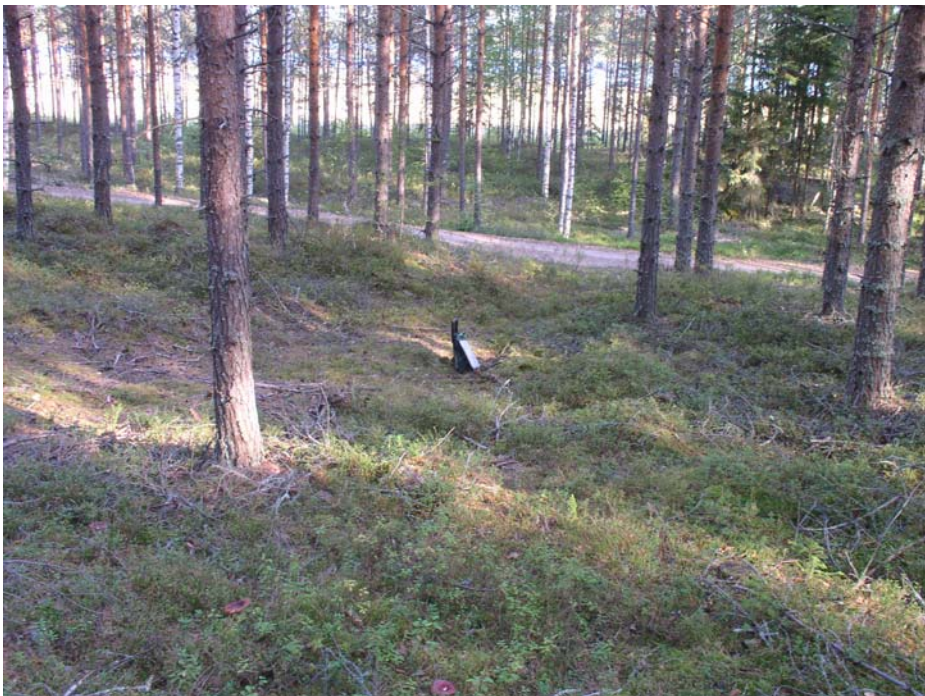
Kotilahti. Läntisempi asumuspainanne kuvattuna luoteesta. Kenttälapio ja karttalaukku ovat painanteessa koekuopan kohdalla. Taustalla tie, ja sen takana Kotilahti.