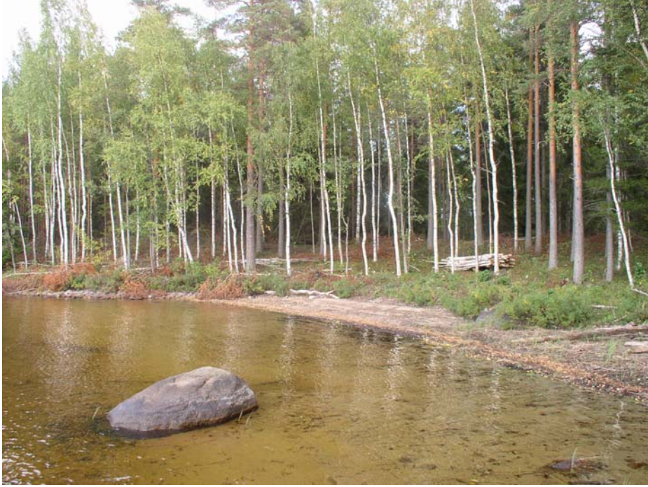
Muurahaisniemi kuvattuna lännestä. Asuinpaikka taustalla harjanteella. Toinen löytöalue rantavedessä.