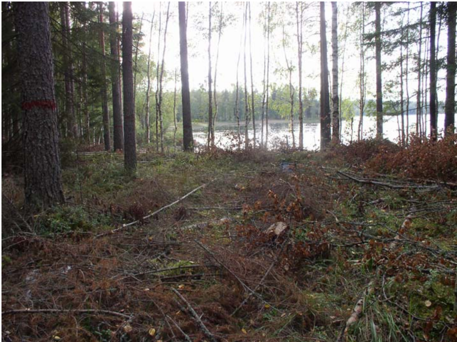
Muurahaisniemi. Harjanteella olevaa asuinpaikkaa kuvattuna idästä. Keramiikan löytökohta kuvan keskellä.