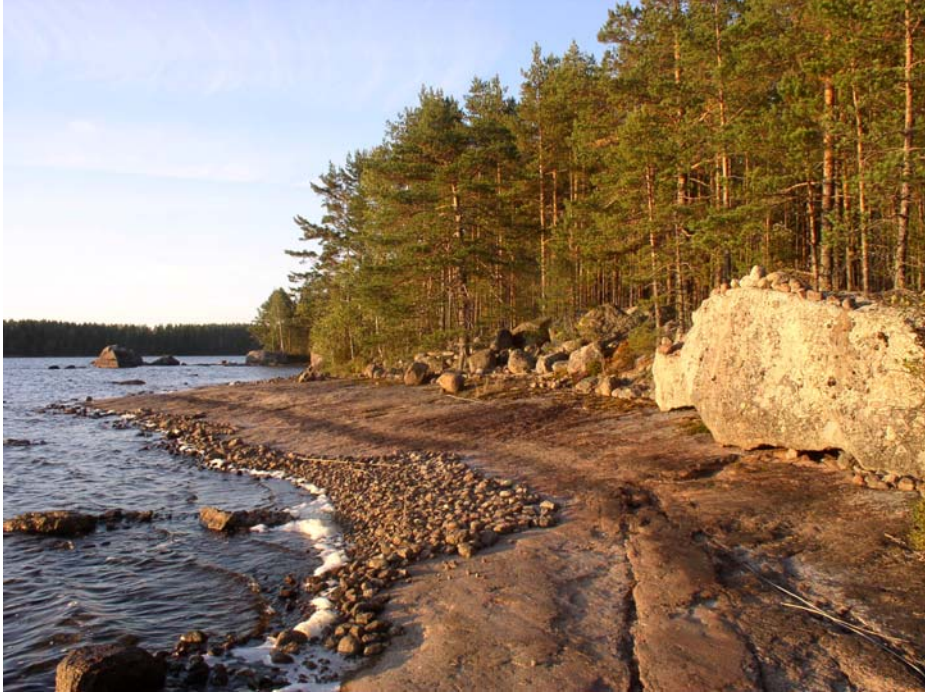
Latoniemi. Rantaa kuvattuna pohjoiskoilliseen. Pyyntikuoppa ja mahdollinen asuinpaikka ovat kivisen rantatörmän päällä kuvan keskeltä oikealla.