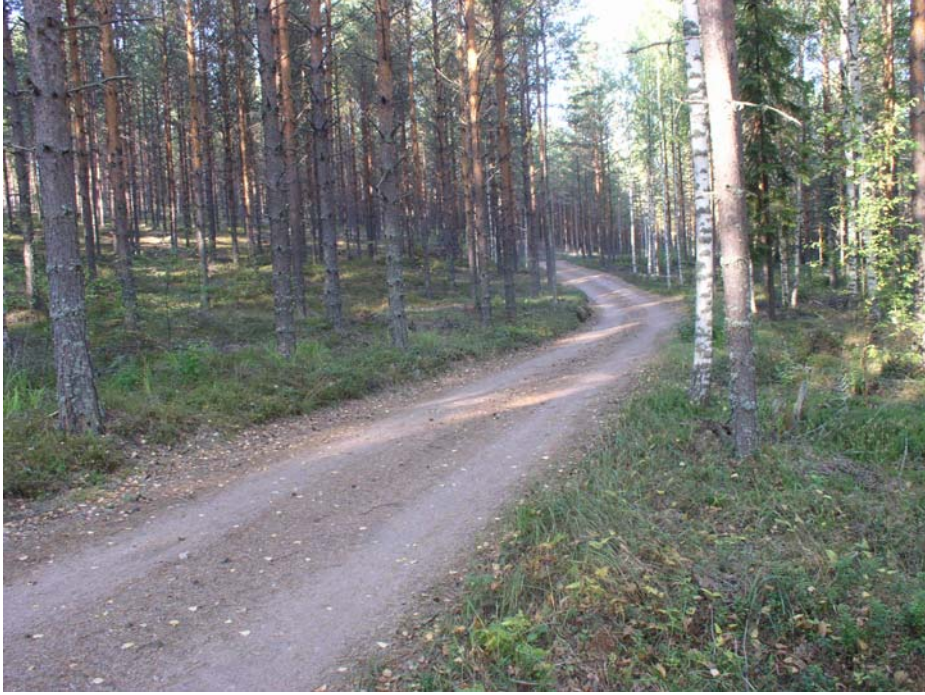
Kotilahti. Asuinpaikan halki kulkeva tie kuvattuna koilliseen. Läntisempi asumuspainanne on törmän päällä kuvan keskeltä vähän vasemmalle. Itäisempi asumuspainanne on taustalla oikealle kääntyvän tien mutkan oikealla puolella.