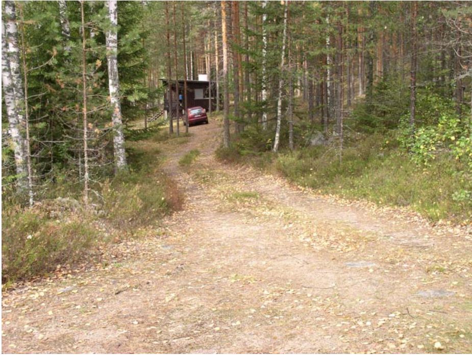
Jänislahti. Asuinpaikkaa kuvattuna tien mutkasta luoteeseen. Etualalla päällytöaluetta mutkassa ja levikkeellä. Taustalla on päällytöalueelta luoteeseen sijaitseva kesämökki.